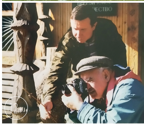
Их объединяла любовь к родной природе