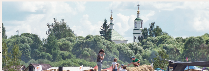
Вид сегодняшнего Льгова

Послушав уже в темноте крикание уток, взяли мы курс на Мценск. Километров пять или семь ехали в плотном дыму — на полях жгли кучи оставленной на пшеничном поле соломы. Свет фар иссякал в двадцати шагах от ма-