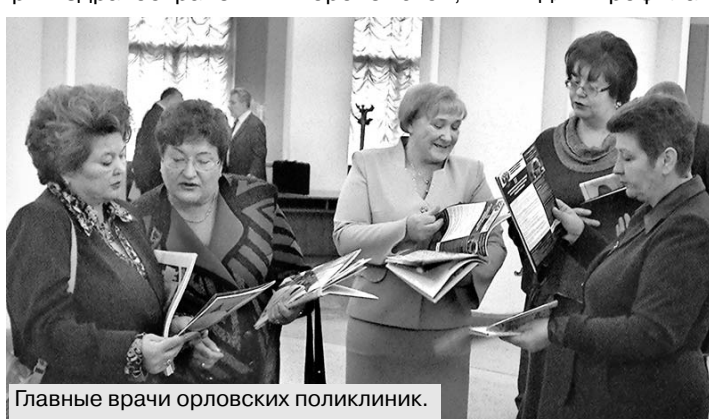
Главные врачи орловских поликлиник.

Мансийский округ, Санкт-Петербург... На заседании прозвучало оптимистичное сообщение о значительном увеличении федерального финансирования для профилактики и борьбы со СПИДом.