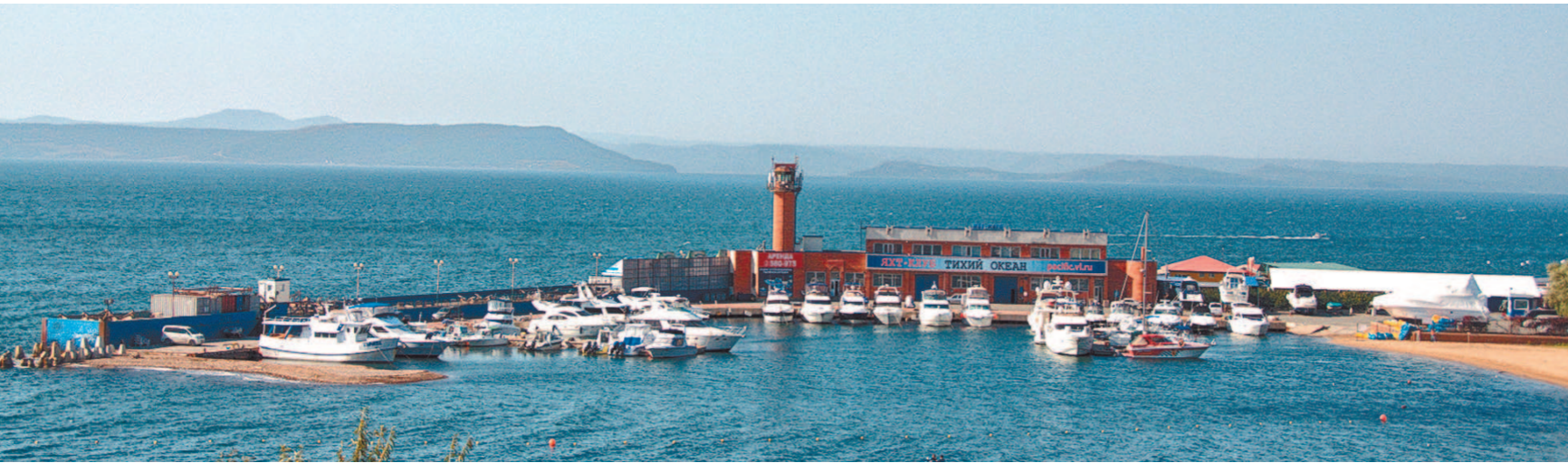
Бухта «Золотой Рог» (Владивосток)

Владимира всегда поража-ли масштабы, могучие мазки