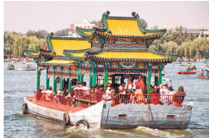
Озеро Бэйхай (в черте Пекина)

ка, песня про животворящий родник Уч-кудук, прячущийся где-то за сто километров, превращается в молитву.