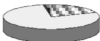
Диаграмма № 3 Структура туристского обслуживания в Орловской области