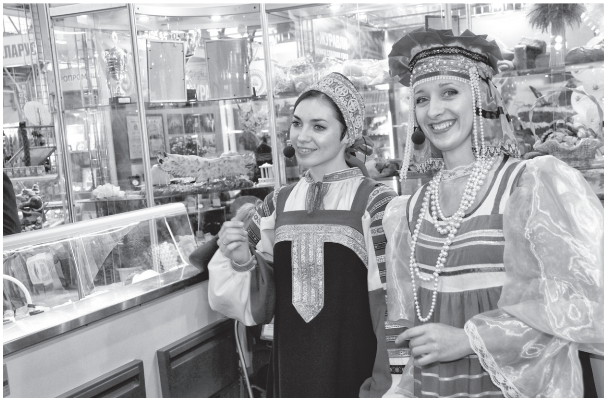
Красавицы из «Веселой слободы» в народных костюмах Орловской губернии

Орловскую экспозицию посетили руководители других регионов, крупные сельхозпредприятий страны, потенциальные инвесторы. Гостей радовал ансамбль «Веселая слобода» Орловского колледжа искусств.