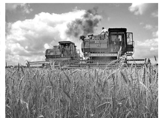
кого районов. Посевные отряды готовы к выходу и на пшеничные поля.

В лучшие агротехнические сроки начался и сев озимых зерновых, почва под которые сейчас готовится в основном ресурсосберегающим поверхностным способом. Первые сотни гектаров засеяны озимой рожью в хозяйствах Болховского, Верховского, Глазуновского, Знаменского, Новодеревеньковского и Уриц-