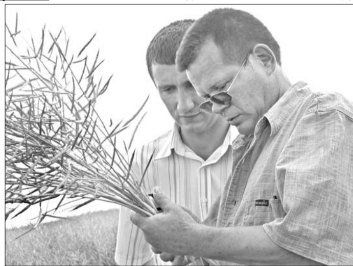
требованы на рынке, как сырье имеют высокий экспортный потенциал. Не случайно — у нас умеренный климат. Культура неприхотлива в технологии возделывания. Кро-

Столь пристальное внимание представителей крупного аграрного бизнеса к этой культуре объясняется просто: возделывание рапса высокопродуктивно (до 300—400% рентабельности), семена вос-