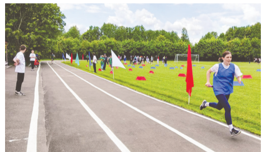
Легкоатлеты бегут эстафету

ным инструментом, причём представительницы прекрасной половины человечества ничуть не уступали в этом деле представителям сильной половины. Главными болельщиками косарей стали их дети и внуки.