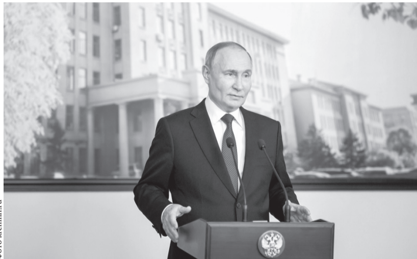
Владимир Путин: — «Мирные формулы» Зеленского основаны на «хотелках», а не на реальной ситуации

Эта тема стала одной из главных на большой пресс-конференции по итогам государственного визита Владимира Путина в Китай.