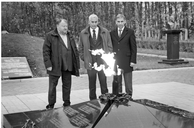
Кубинцы знают, что такое защищать родную землю

В ходе визита на орловскую землю кубинцы по-