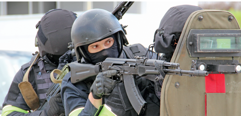
Собровцы на боевом задании