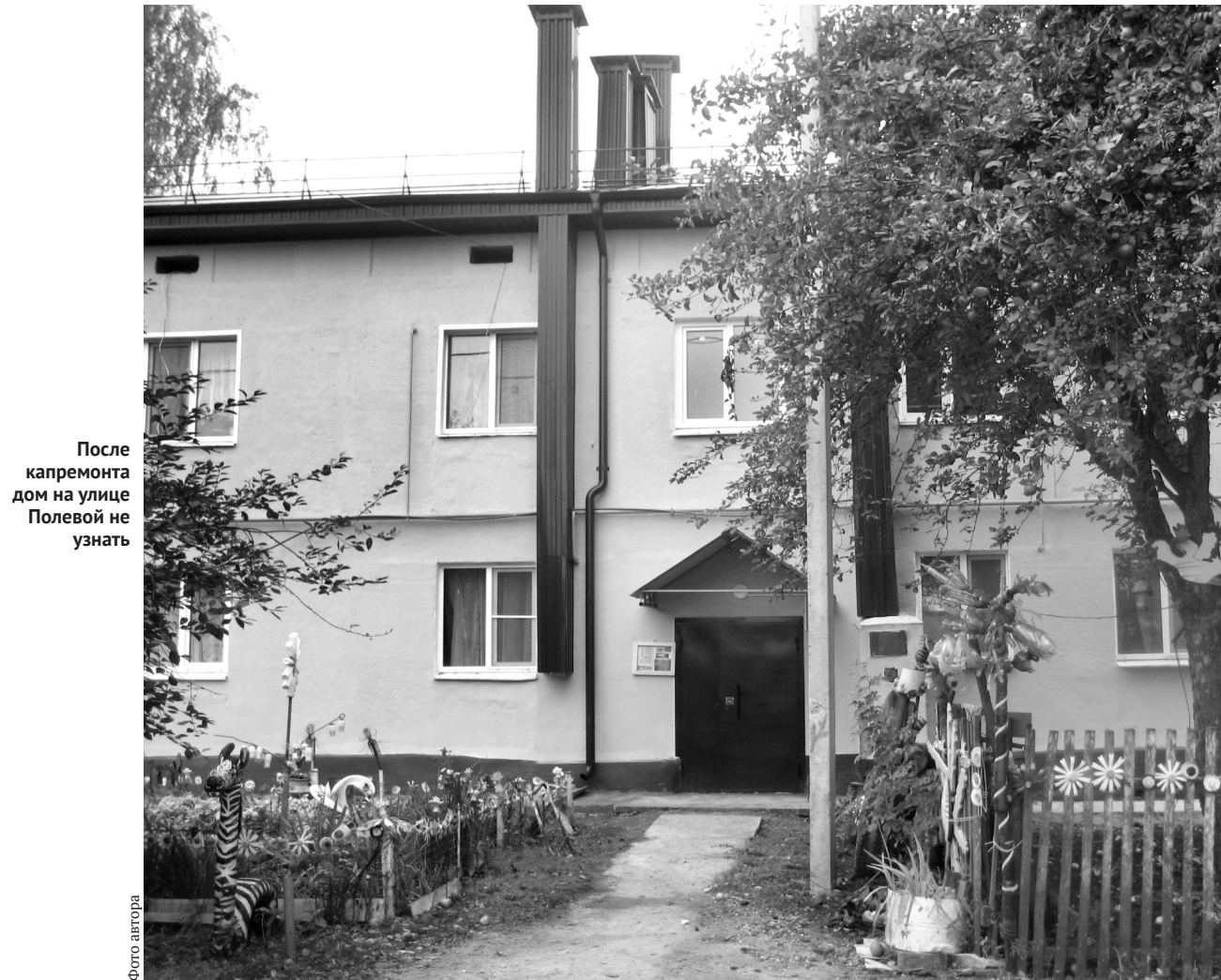
После капремонта дом на улице Полевой не узнать