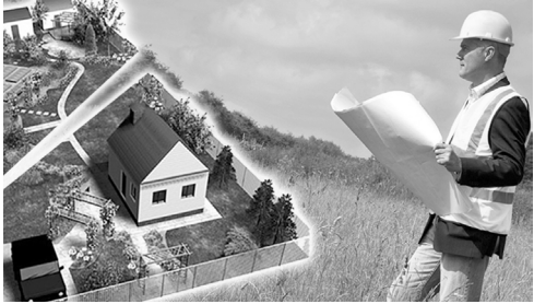
Теперь оформить земельный участок станет гораздо проще

Законопроект предусматривает установление единообразного порядка определения видов разрешённого использования земельных участков. Согласно нововведениям виды разрешённого использования должны устанавливаться соответствующими регламентами использования территории: градостроительным — для земель населённых пунктов; лесохозяйственным — для земель лесного фонда; также положением об особо охраняемой природ-