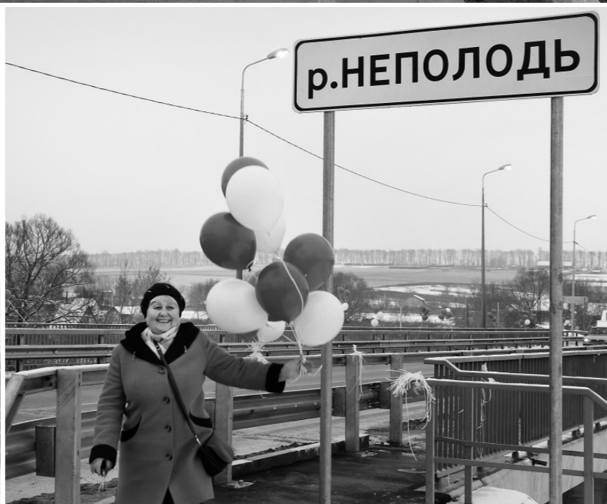
18 декабря состоялось долгожданное открытие моста