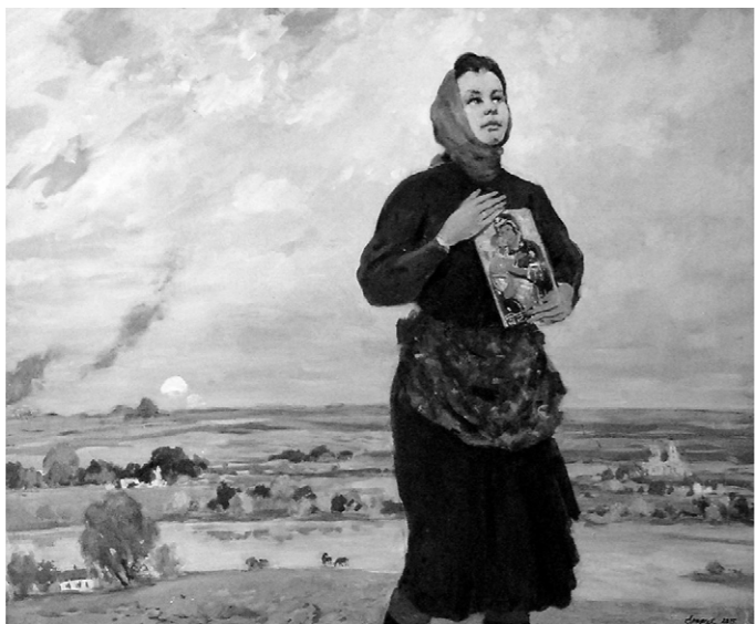
В. Ерофеев. «Молитва матери»

петные, пронзительные произведения, в которых и боль, и страдание, и радость Победы. Как, например, в серии графических работ «Родная калитка» орловского мастера, заслуженного художника России Николая Силаева. Он нашёл потрясающую метафору: первый лист «Июнь» — солдат покидает родной дом, центральная композиция «Мать. Ожидание» — старушка в трешке у калитки, и, наконец,