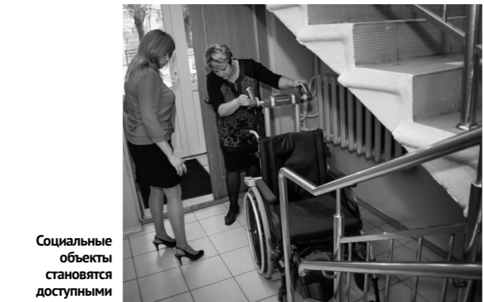
Социальные объекты становятся доступными для инвалидов