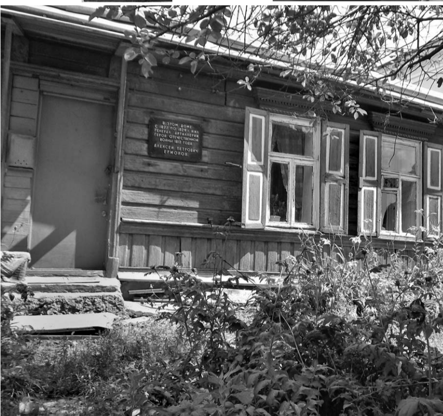
Ермоловский дом в Орле

да они перемещаются в постоянном движении, меняются и kloкочут. Здесь застывшие формы, и нужно создать момент, убедительный для всех зрителей со всех точек осмотра.