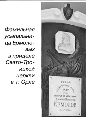
Фамильная спальня-ца Ермоловых в приделе Свято-Троицкой церкви в г. Орле