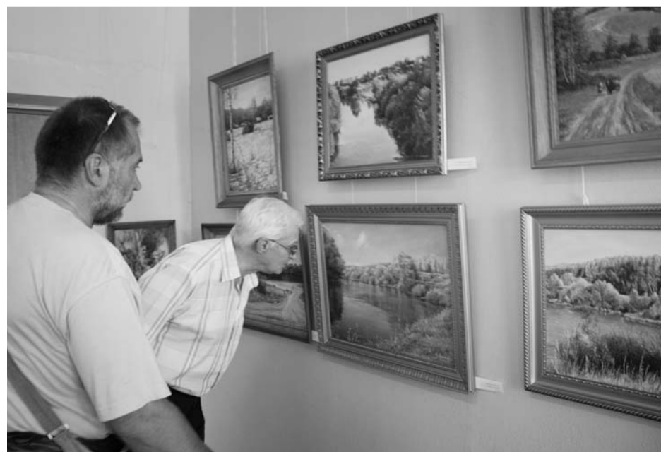
А что это тут?

В этот раз на выставке представлено 225 работ 62 авторов. Помимо традиционных портретов, натюрмортов и пейзажей здесь представлены и фотографии.