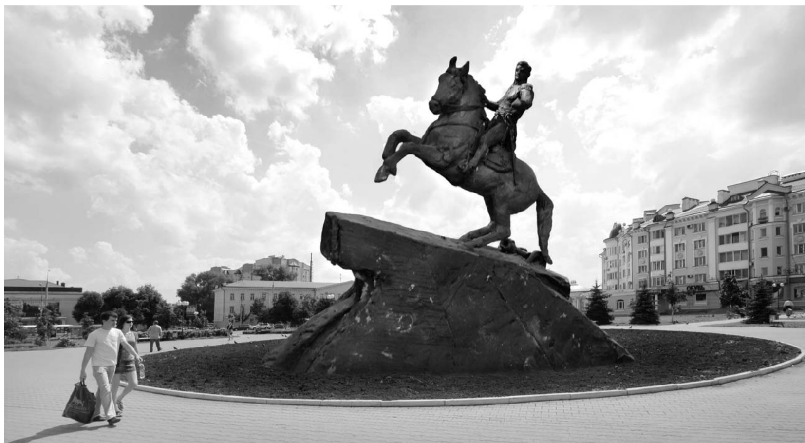
Площадь Ермолова через год. Не хватает лишь детали — разбитой пушки батареи Раевского

— За основу взят образ Медного всадника. Но это не прямая «цитата» Медного всадника. Во-первых, наш всадник — бронзовый, это шутка, конечно. А во-вторых, задача показать напор, стремительность, сказать нечто новое, свое — задача скульпторов всех времен. В-третьих, среди конных монументов очень редко встречается удачное исполнение. Соединение, симбиоз лошади и человека в скульптуре — самая сложнейшая проблема. Редко кому удается спать в памятнике эти две равнозначные фигуры. Нет мгновений, ког-