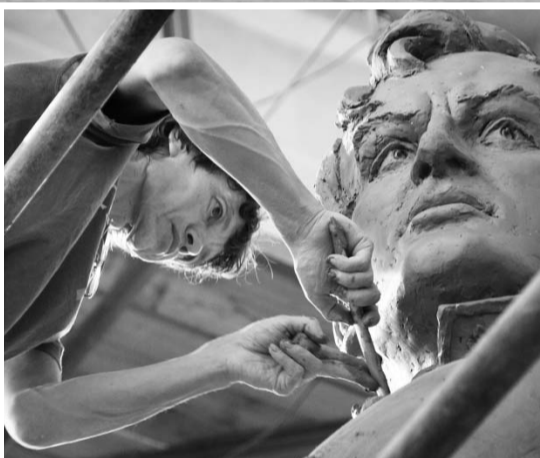
Мастер и генерал — два героя нашего материала