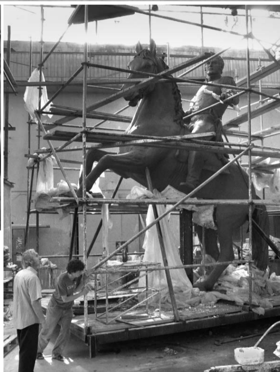
Глиняная модель статуи в цехе художественно-производственного объединения — «родильном доме» легендарных русских монументов