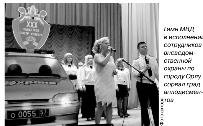
Гимн МВД в исполнении сотрудников вневедомственной охраны по городу Орлу сорвал град аплодисментов

Орловские стражи порядка зажигали на ежегодном областном конкурсе самодеятельности.