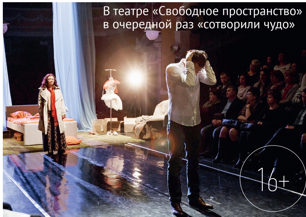
В театре «Свободное пространство» в очередной раз «сотворили чудо»

Эти двое встречаются в середине своей жизни, которую прожили по-разному. Гитель, по сути, неудачница, бывшая танцовщица, которой не удалось воплотить ни одного из своих артистических мечтаний. Она чиста, нежна, очаровательна и совершенный — непрактичный,