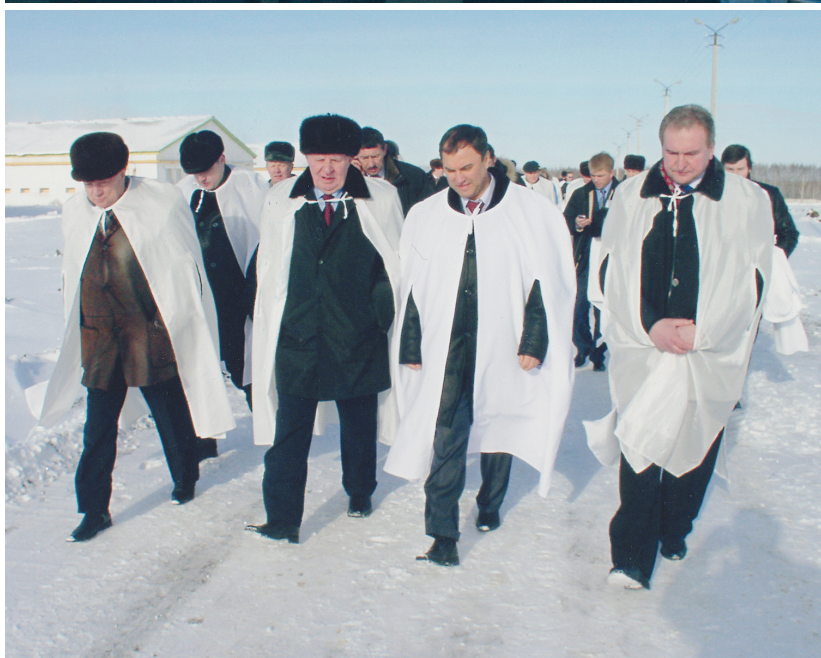
Посещение генеральным секретарём совета партии «Единая Россия» В. В. Володиным птицефабрики «Орловская Нива»