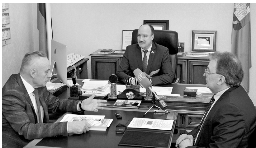
Число обращений к омбудсменам в 2018 году заметно уменьшилось