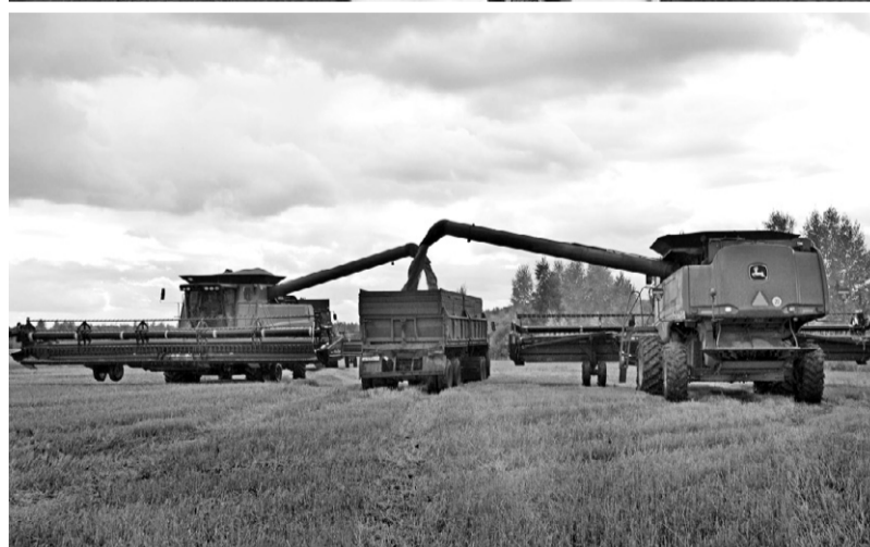
Рекордные урожаи зерновых на Орловщине уже никого не удивляют

— Компенсация затрат на строительство объектов АПК — действенная мера господдержки