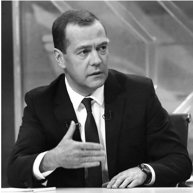
Дмитрий Медведев: — Мы должны обеспечить темпы роста экономики до 4% в год

— Нам нужно двигаться дальше, меняя структуру экономики, — подчеркнул Дмитрий Медведев. — И в этом смысле мы такое движение видим. Первое — это ситуация в сельском хозяйстве, которое в 1990-е годы называли «чёрной дырой». Мол, в сельском хозяйстве нечего ждать каких-то изменений, все продукты будем покупать за границей... Но это же неправильно. Россия исторически была поставщиком продуктов и на внутренний рынок, и на рынок Европы и других стран. Буквально за последние несколько лет нам удалось выйти на прирост сельского хозяйства в 3% в год — и это в условиях в целом нисхо-