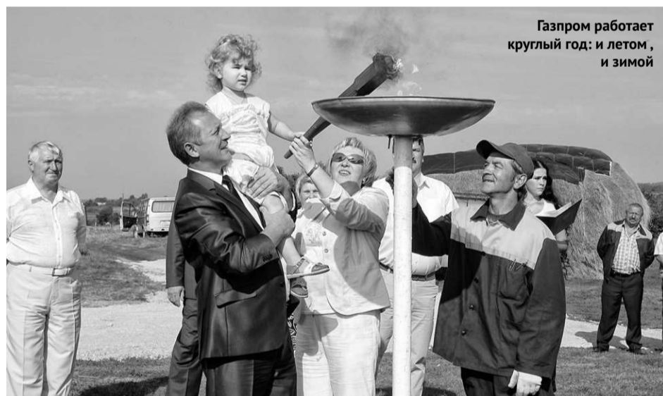
Газпром работает круглый год: и летом, и зимой

Значение этого события для областного центра трудно переоценить. «Голубое кольцо» протяженностью более 25 километров жизненно необходимо активно развивающемуся в последние годы Орлу. Только на территории 200-гектарного микрорайона Зареченский предусмотрено строительство 670 тысяч квадратных метров жилья эконом-класса. В 14 тысячах квартир микрорайона будут проживать более 22 тысяч человек. Уже в 2014 году планируется ввести в эксплуатацию шесть многоквартирных домов общей площадью 62 тысячи квадратных метров.