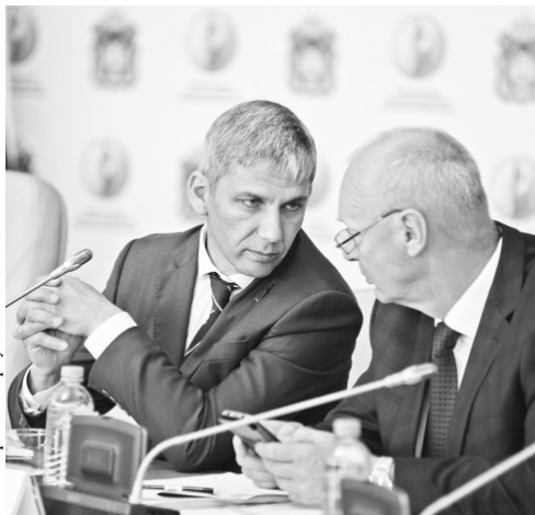
Орловщина — успешный аграрный регион