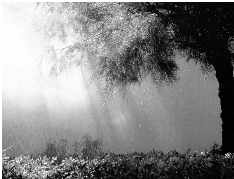
Фото Ю. Букина, г. Орел.

Наш адрес: 302000, г. Орел, ул. Брестская, 6, к. 33.