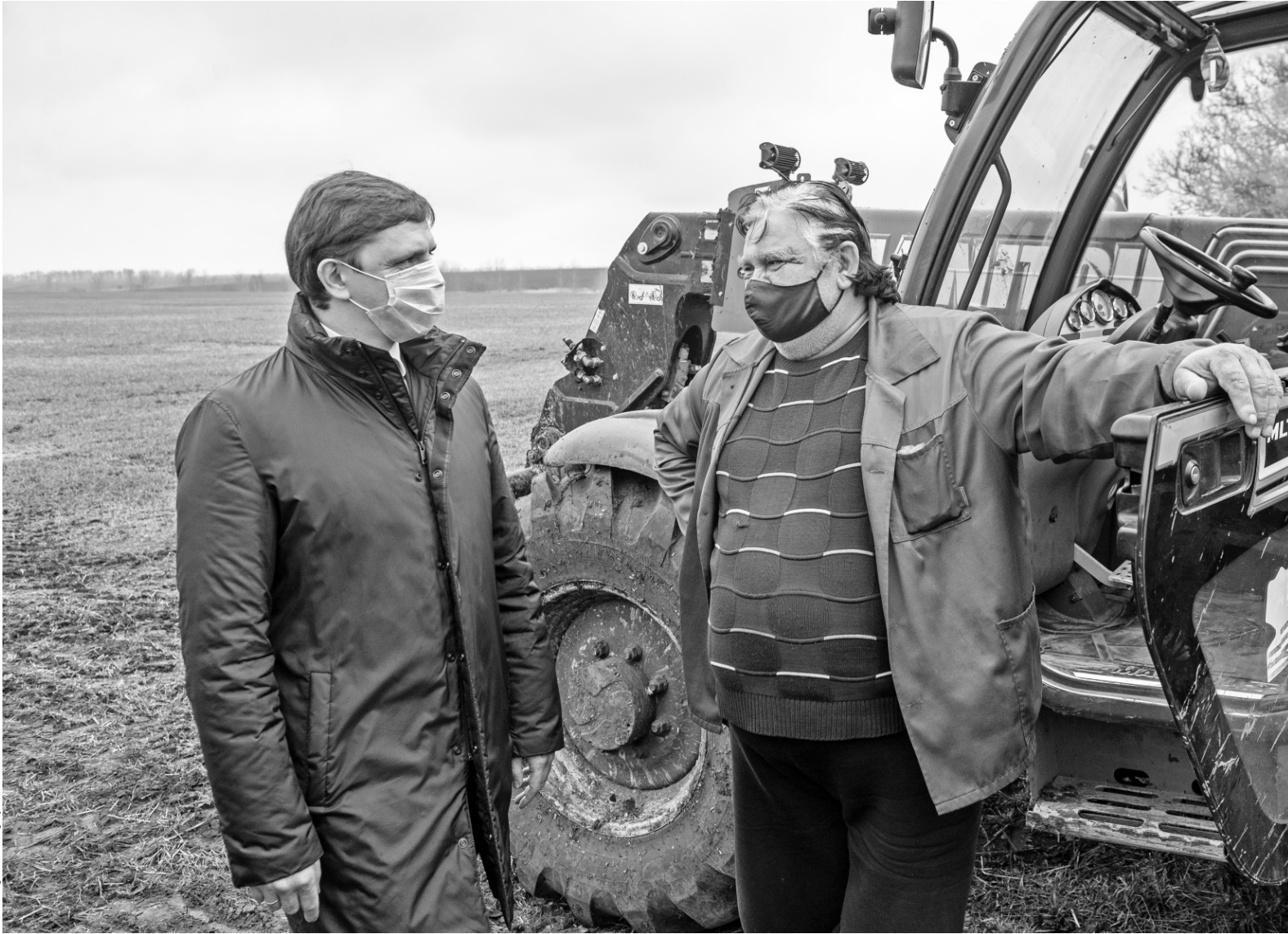
Несмотря на отставание от сроков, аграрии рассчитывают на хороший урожай