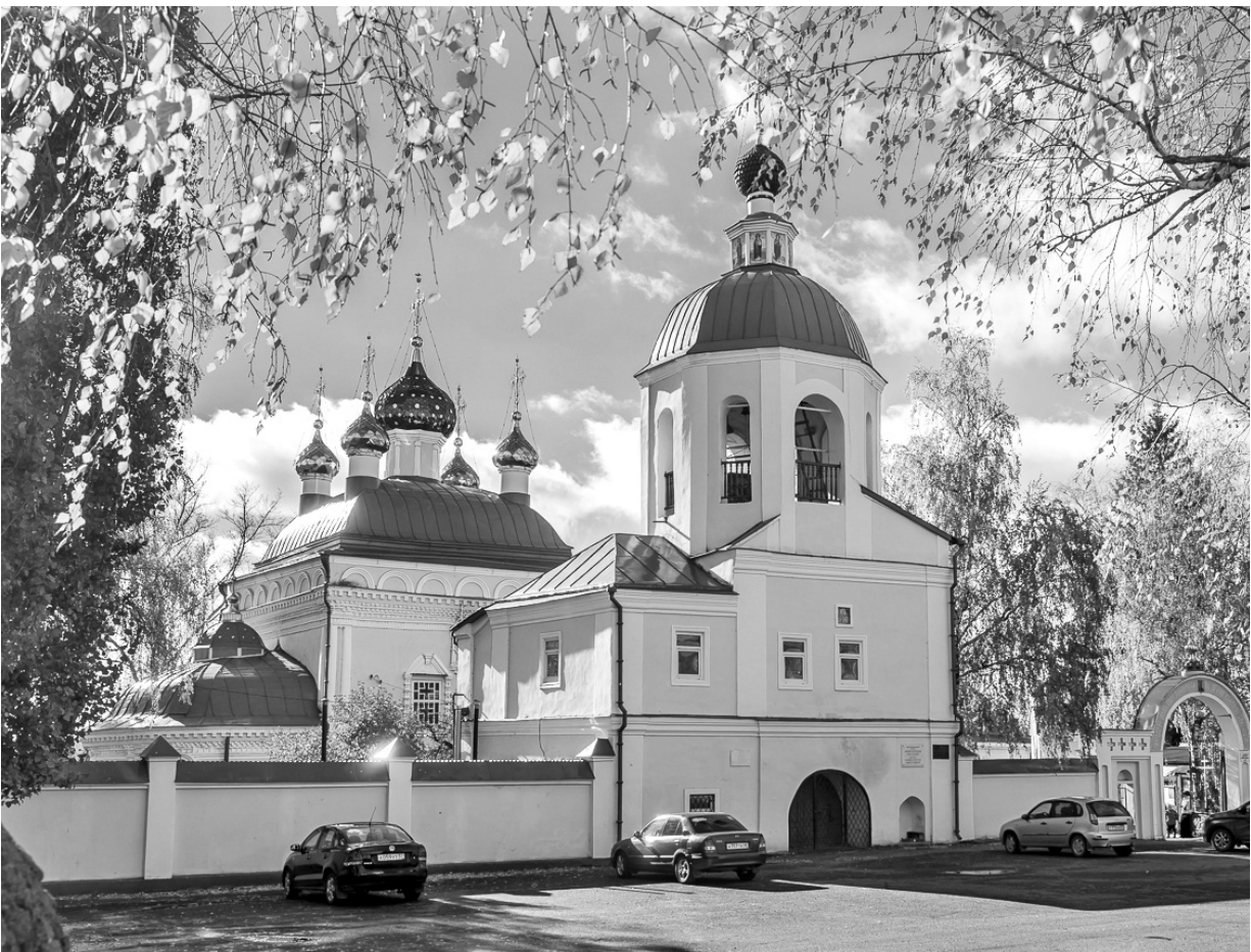
Свято-Сергиевский кафедральный собор г. Ливен

Ливны — необычный город. Почему-то историки никогда не говорят о том, что именно этот районный центр приходится близнецом Воронежу. Одним указом от 1 марта 1586 года «поставить воеводу» — крепости: одну — на реке Воронеж, другую — на Быстрой Сосне... Великое оби-