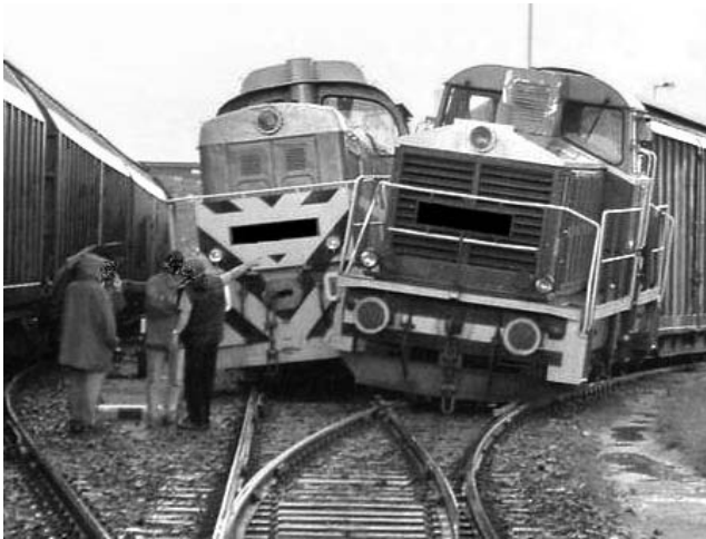
Автор этой подписи стал победителем нашего конкурса за прошлый месяц. Поздравляем!

Они из разных мест, пространство рассекая, Случайно встретились друг другу на пути. Так в жизни, причин прямых не зная, Другим мешаем к счастью мы идти.