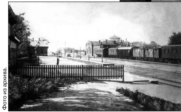
30 лет линии Железнодорожников — Орёл, в июле 2007 года мы отметим 40 лет фирменному поезду

Выход в свет книги совпал с чередой юбилеев, связанных с железными дорогами области. Так, в минувшем году исполни-