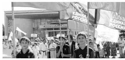
Гимн России звучал в этот день повсеместно.

Работники культуры подготовили концертную программу для кромчан и гостей района.