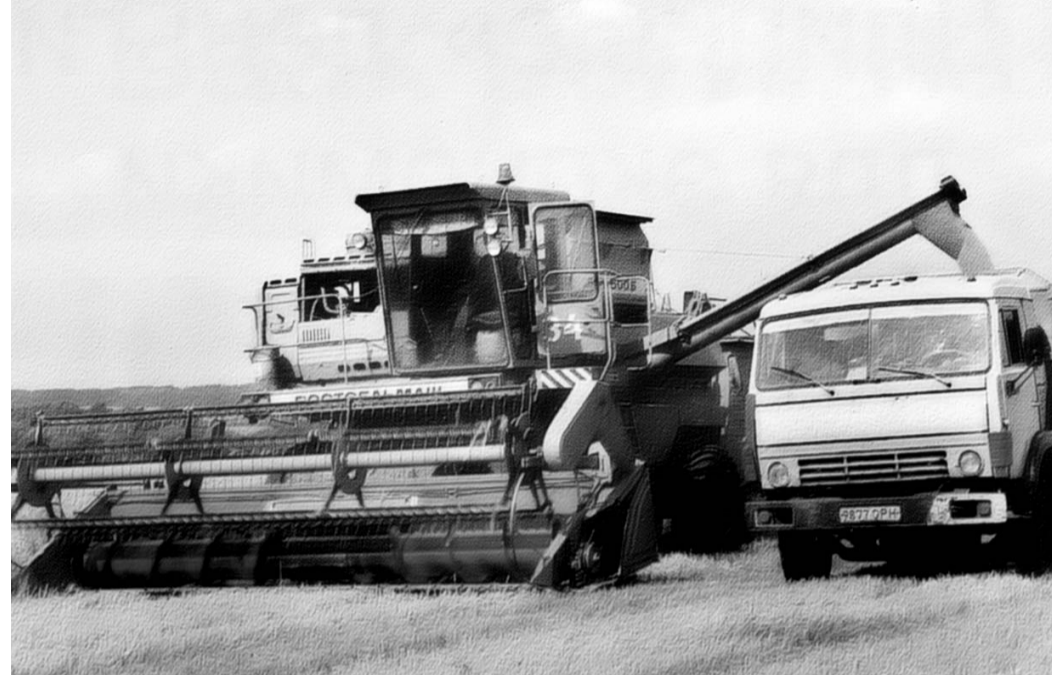
производства к 2010 году. Отсюда — другое задание: привлечение крупных инвестиций и крупных компаний.

На протяжении последних лет среднегодовые темпы прироста промышленного производства превышают общероссийские: в 2005 году — 110,3 процента (российский — 104 процента). Обрабатывающие производства имели годовой уровень еще больше — 112,7 процента. За I квартал 2006 года индекс промышленного производства составил 105 процентов. Растет доля инновационного производства, заработной платы, расширяются рынки сбыта. Планы развития промышленности области в 2006—2008 годах предусматривают укрепление достигнутых положительных тенденций, ее дальнейшее инновационное развитие и значительное повышение