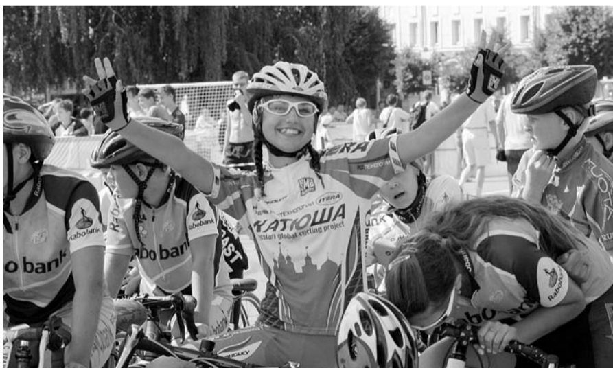
Улыбка — главная награда

— Праздник посвящен 68-й годовщине освобождения города Орла от