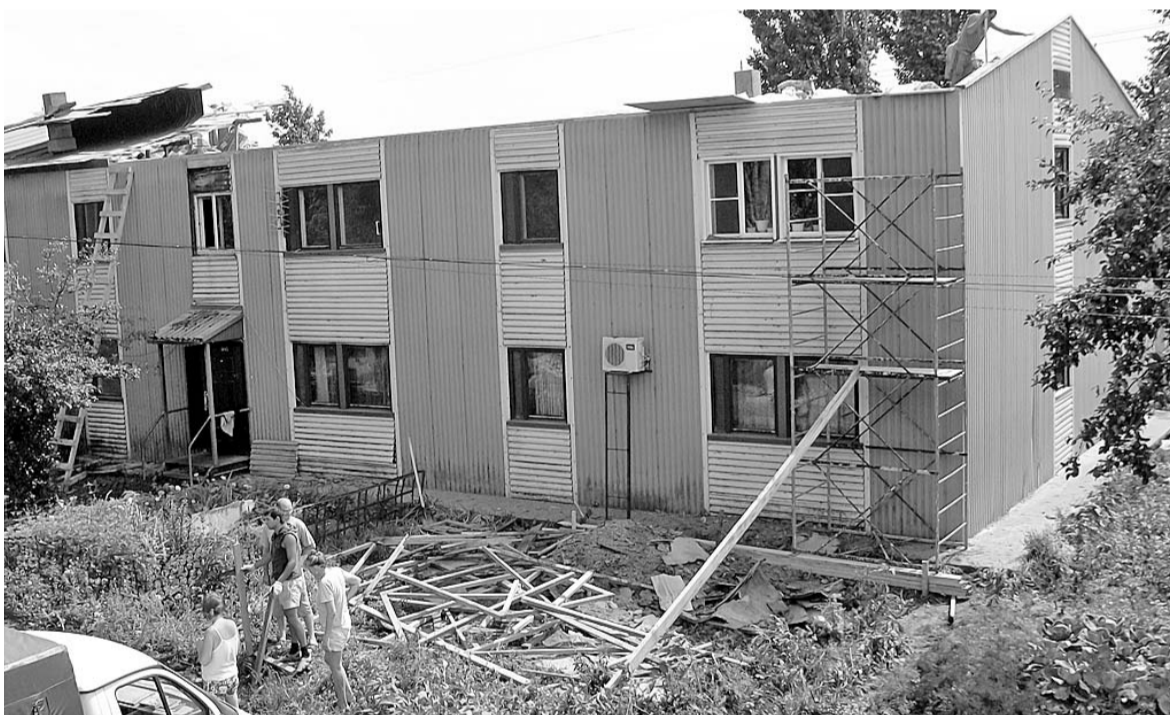
Дом № 33. Вид без крыши