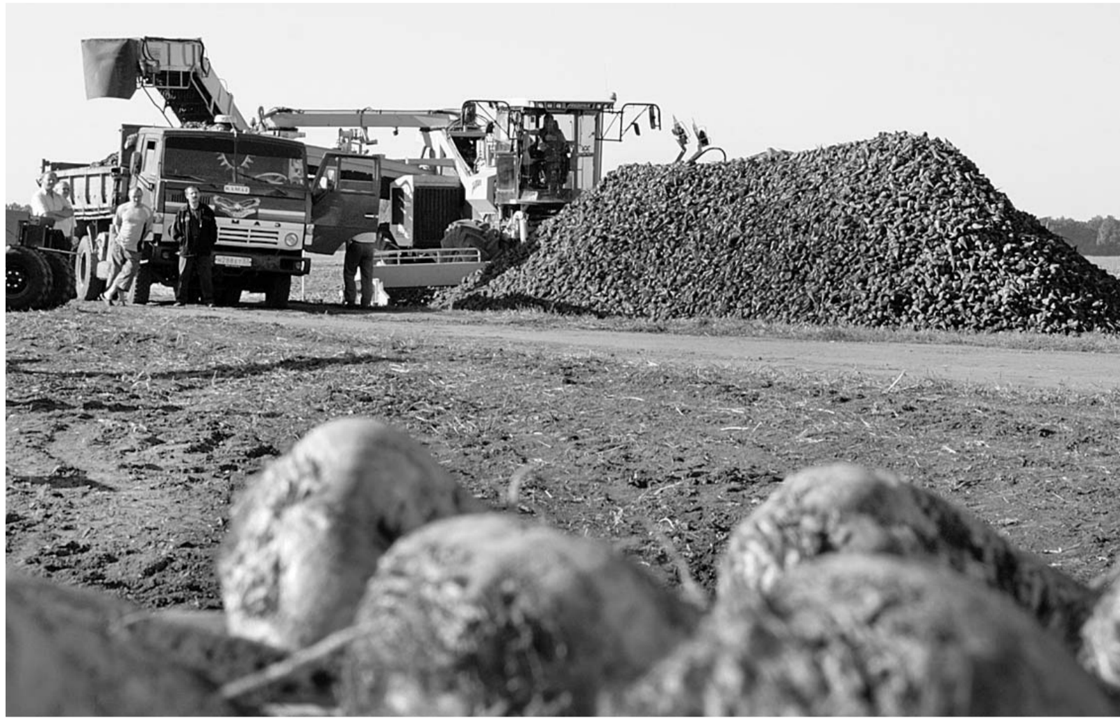
На 25 июля в Орловской области средний вес корня сахарной свеклы достигает 250 граммов

лась в прошлом году, когда эксперты прогнозировали спад мировых цен на сахар. Вряд ли компания-инвестор возьмется за масштабную реконструкцию предприятия, если бы свеклопереработка не была бы привлекательной отраслью.