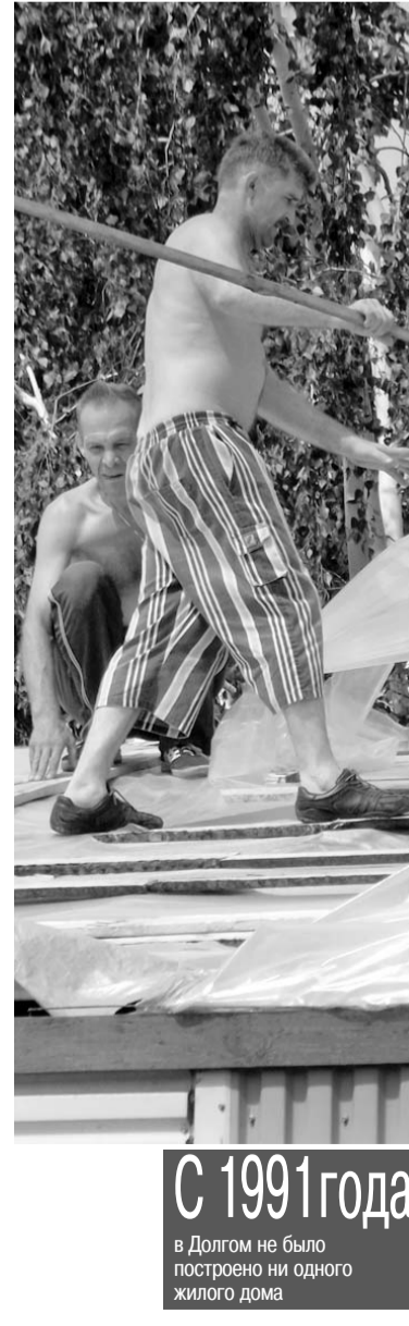
Жители дома № 32 пытаются закрепить на крыше пленку

«При приемке дома № 33 мы поднимались на чердак?», — спросил я у начальника отдела архитектуры Должанского района Ольги Герасимовой. «Нет», — последовал лаконичный ответ. В разговоре она сообщила, что капремонт в указанном доме был проведен без проектной документации. «Это обычная прак-