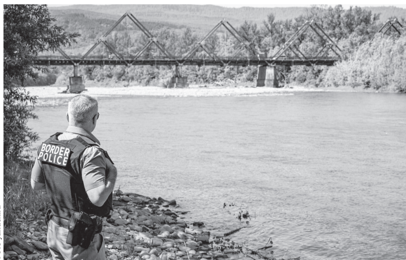
Между окопами и Тисой украинцы призывного возраста выбирают смертельно опасную реку

Только в мае, пытаясь форсировать ледяную Тису, на спасительный берег не смогли выбраться двадцать «ухлянтов» — уклонисты либо тонули в волнах быстрой реки, либо по ним, как в тире по движущимся мишеням, украинские погранцы открывали огонь на поражение.