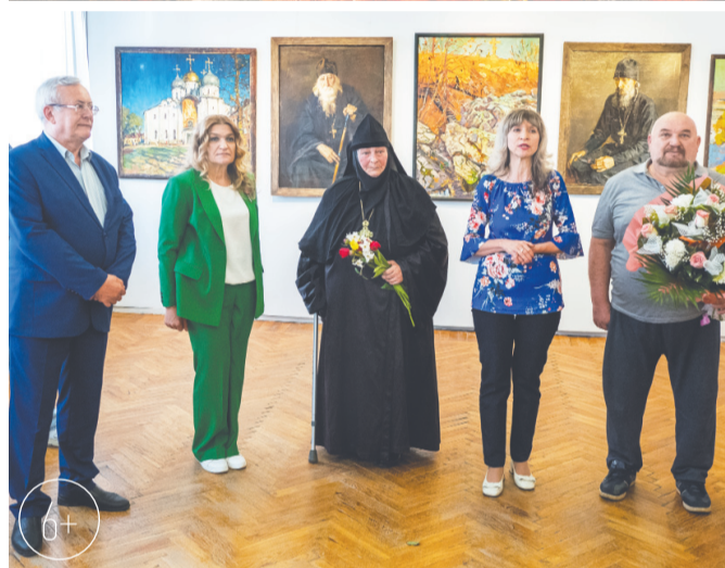
Много тёплых, искренних слов в адрес художника было сказано почётными гостями выставки