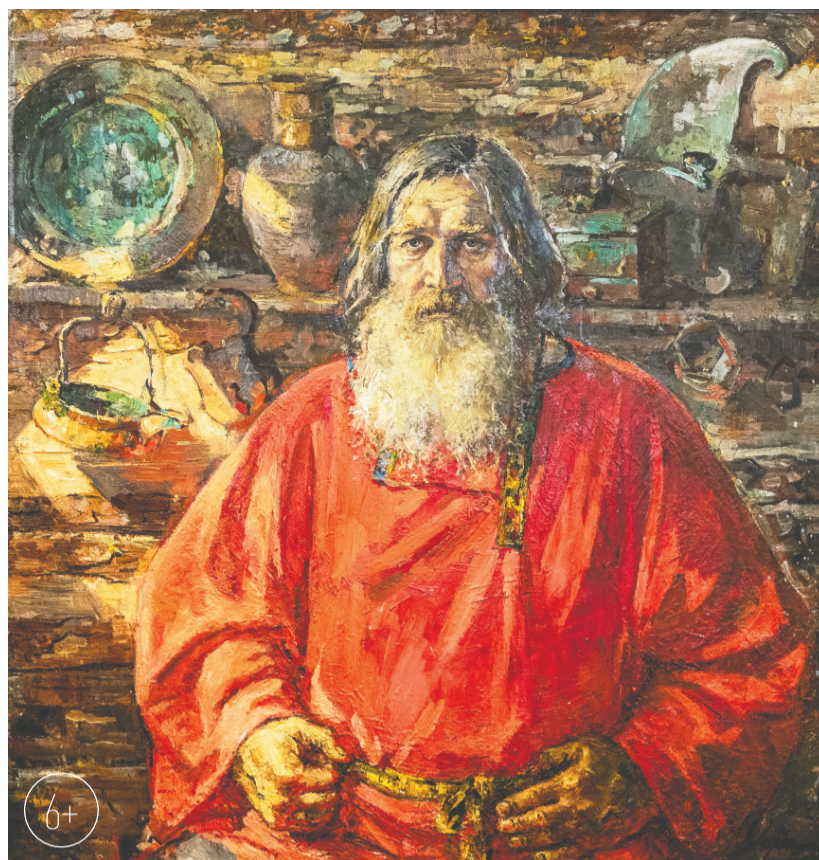
«Красная рубаха». 2019 г.