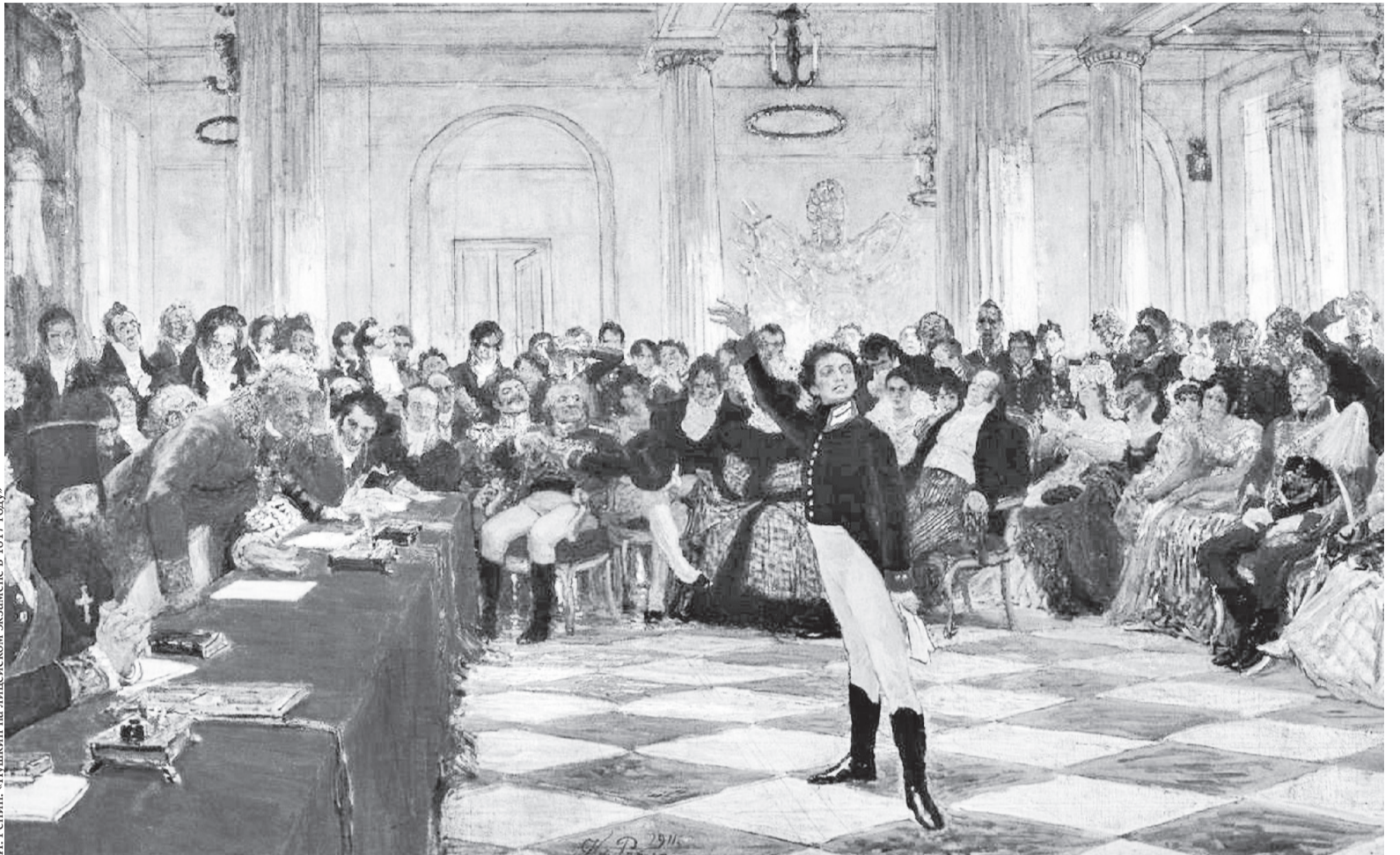
И. Репин. «Пушкин на лицейском экзамене в 1817 году»