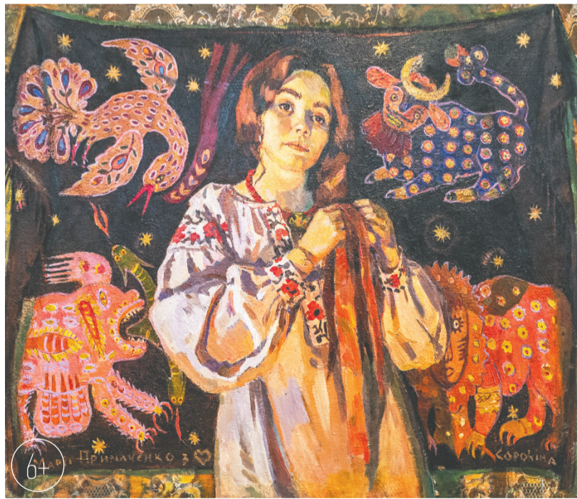
«Посвящение художнице-народнице Марии Примаченко». 2022 г.