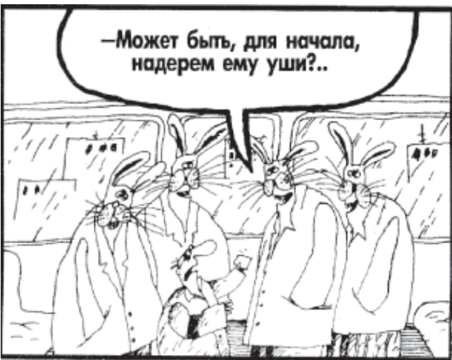
Прижали его хорошенько. Так он еще... в окошко хотел выскочить. Куда там! А еще мама его приходила разбираться, как это ее сын штраф ни за что платить будет?! Ну, я ей покачала студенческий билет ее сыночка. Посмеялись вместе.