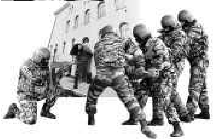
Коллаж Игоря ТИНЯКОВА.

в одном из местных казино, но «ставки» там показались ей слишком маленькими, и она принялась за более выгодное дело. Только теперь из разовой торговли с несколькими дозами на руках Могила превратилась в маститую «наркобаронессу» ливенского значения и руководителя преступной группы, что на блатном жаргоне означает маруха, или Машка, — женщина-главарь. Ее квартира оказалась главным «штабом» преступной группы.