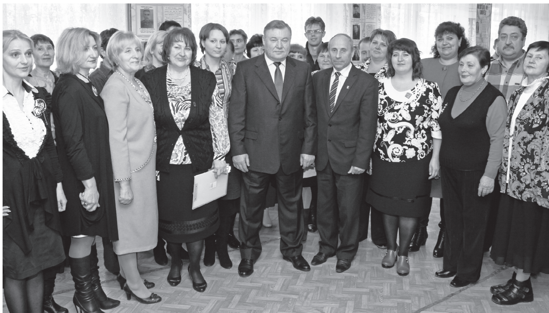
Коллектив средней школы № 1 г. Дмитровска с энтузиазмом воспринял слова губернатора о выделении средств на ремонт школы

20 ОКТЯБРЯ АЛЕКСАНДР КОЗЛОВ ПОБЫВАЛ В ДВУХ РАЙОНАХ ОБЛАСТИ