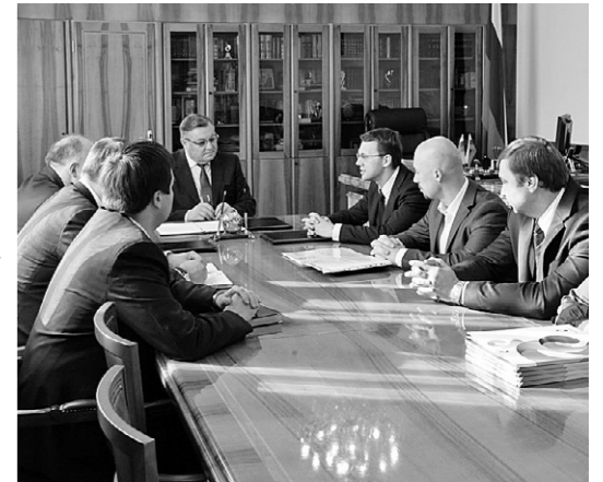
ГУБЕРНАТОР ОРЛОВСКОЙ ОБЛАСТИ УКАЗ

Пресс-служба Губернатора Орловской области