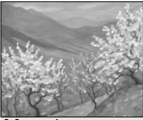
О. Оленина. «Алушта в марте».