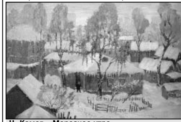
Н. Комов. «Морозное утро».

ражая внутренние переживания автора. Каждый посетитель выставки обязательно найдет что-то себе по душе. Цена входного билета копеечная. Работать экспозиция будет до 27 июля. Так что даже самые медлительные читатели успеют познакомиться с искусством тоховцев.