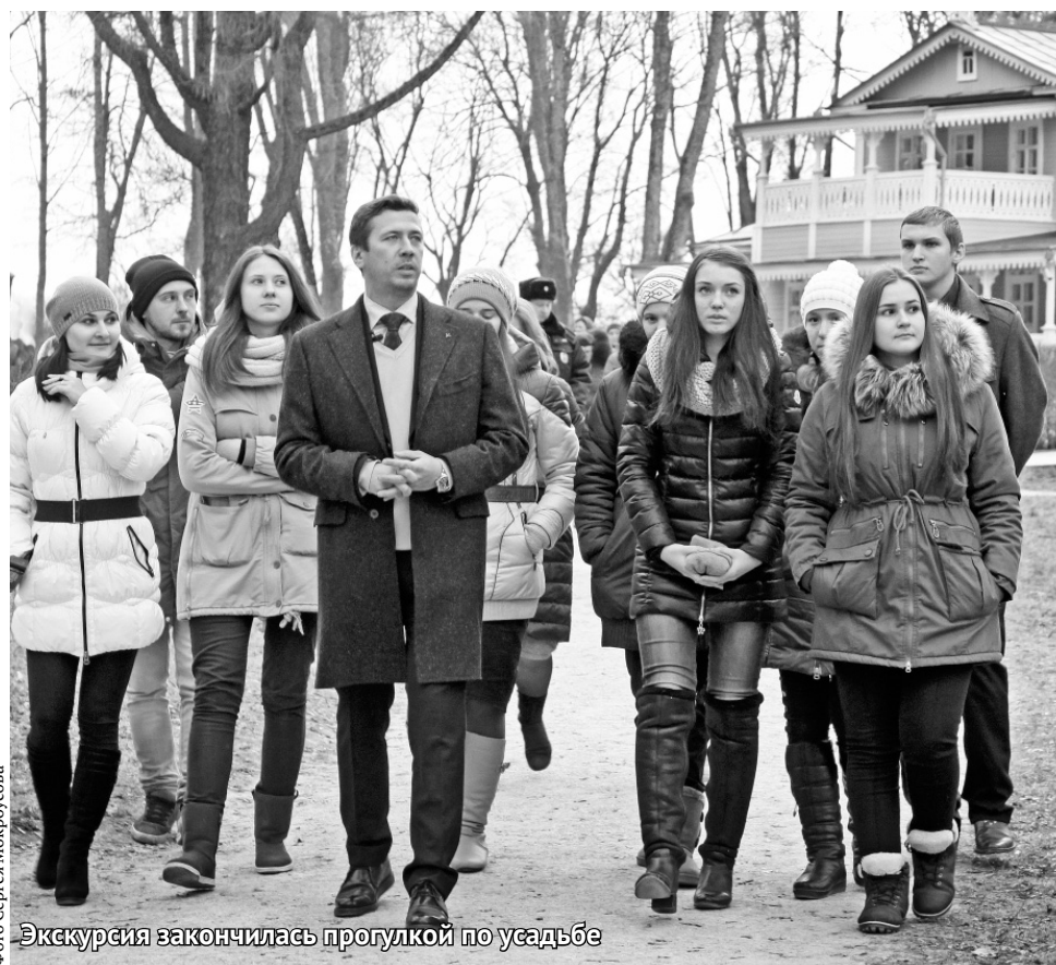
Экскурсия закончилась прогулкой по усадьбе

сантами в этот день стали ученики старших классов Спасско-Лутовиновской школы. Они, конечно, уже не раз были в музее, но признались, никогда так, как в этот день, они не смущались еще. Ведь экскурсию проводил для них один из самых популярных российских актеров.