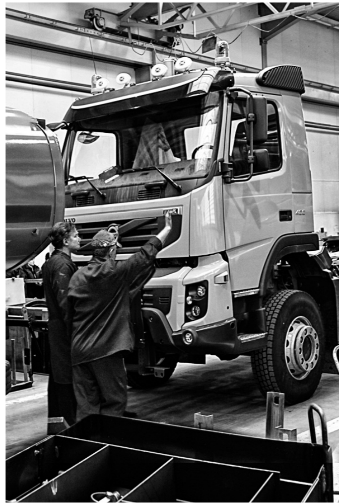
Мценский завод «Коммаш» в прошлом году увеличил свою чистую прибыль в 2,6 раза (по сравнению с предыдущим годом) — до 30 млн. 852 тыс. руб.