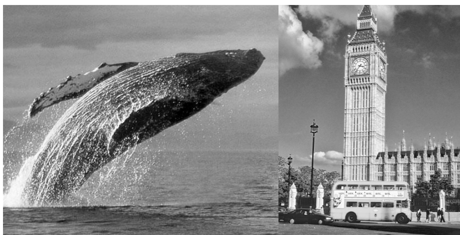
Антиподом орла является местность в Тихом океане, где обитают синие киты