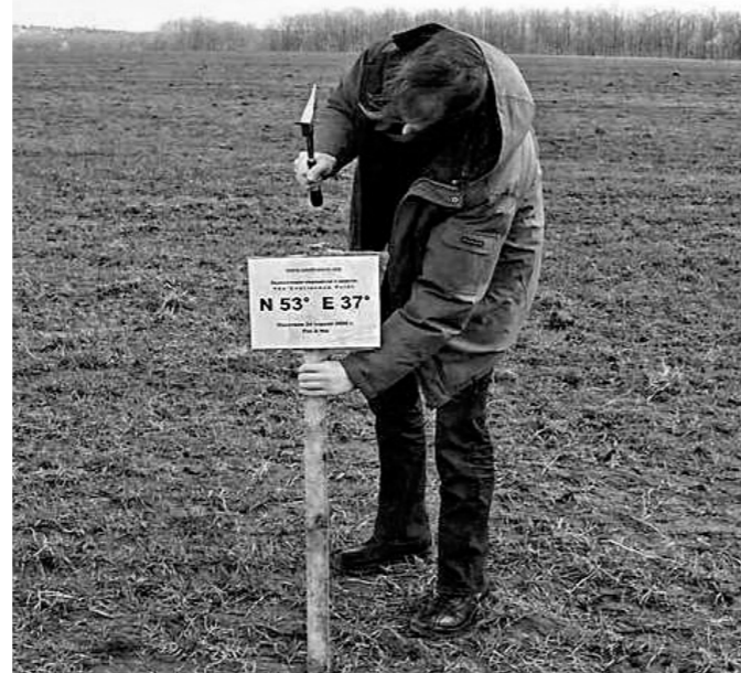
Участник проекта «Degree Confluence Project» устанавливает табличку с координатами в Новосильском районе

океан этот совсем не тихий. В этом месте по дну проходит Южно-Тихоокеанское поднятие, которое входит в систему срединно-океанических хребтов. Это граница раздвижения литосферных плит, где наружу выплескивается раскаленная лава. На поверх-