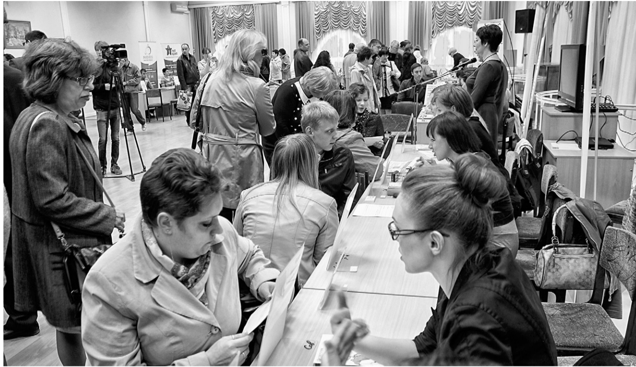
Традиционные ярмарки вакансий — реальный шанс найти работу

наружной отделке домов и офисов, разработке дизайна интерьеров. В Корсаковском районе появился новый для местных жителей и очень быстро ставший востребованным вид услуг — парикмахерская на дому.