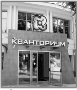
Функционирует детский технопарк «Кванториум»