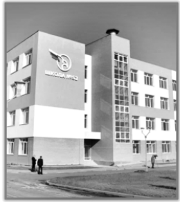
Введена в эксплуатацию школа на 1 225 мест