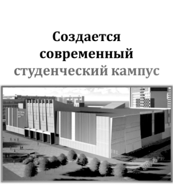
Создается современный студенческий кампус