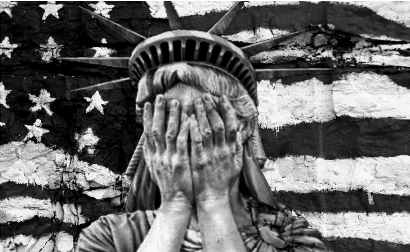
Фото из запада

массовой информации, законодательную и во многом исполнительную власть, блокируя любые решения президента. Олигархический капитал путём массированных фальсификаций за четыре года сумел по существу отстранить президента от исполнения должностных обязанностей, предусмотренных Конституцией США. Объединившийся против Трампа капитал взял под контроль не только СМИ и конгресс, но и силовые структуры. Против Трампа выступил мозговой центр мирового олигархата, так называемый «Римский клуб». Старый мир, считают они, обречён, и создают свой новый миропорядок. Капитал заигрывает с угнетёнными массами, особенно среди чёрного населения, используя их в своих целях. По этой причине в США идут погромы и разрушения. Если Трамп врагом номер один считает Китай и начал открыто не только торговую, но и холодную войну, то Байден, напротив, главным врагом считает Россию, где очень сильна «пятая колонна», тесно связанная с мировым, особенно американским, капиталом. Для силового влияния на Россию и в помощь «пятой колонне» создаётся дуга нестабильности: Турция — Украина — Польша, которая опираясь на наших толстошумов, счета и жильё которых в Лондоне, США и в офшорах, пытается сначала ослабить, а потом и подчинить Россию своему влиянию. С этой целью президент Украины господин Зеленский посетил