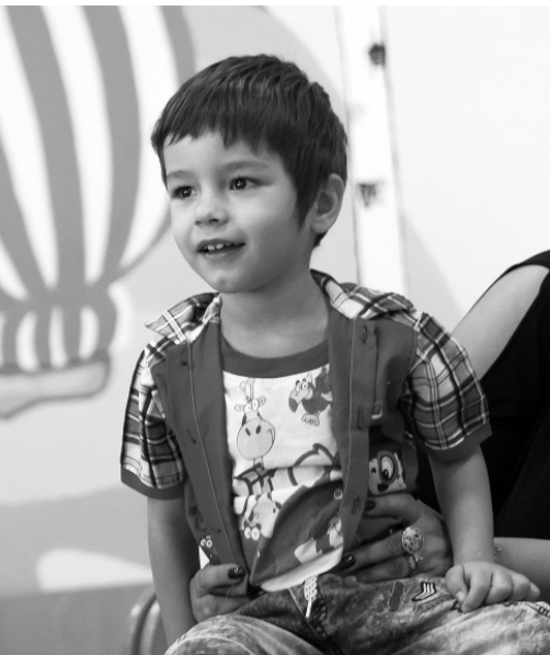
Любовь и забота творят чудеса

Если наш центр внесут в реестр поставщиков социальных услуг, нам будут компенсировать из регионального бюджета средства на оплату труда сотрудников «БОЖЬЕЙ КОРОВКИ». Тогда мы сможем принять у себя в три раза больше детей.