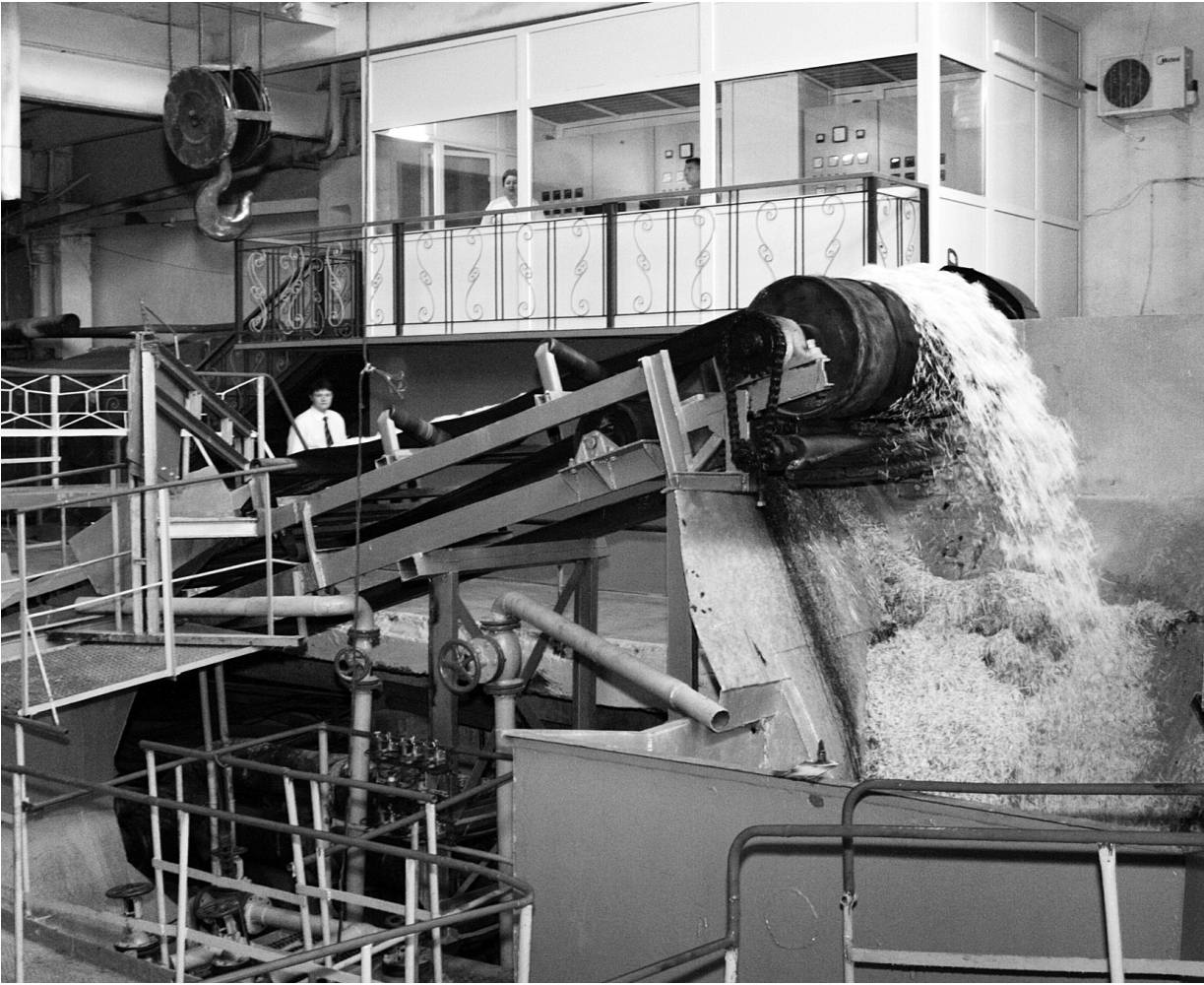
Сахарные комбинаты «Отрадинский» и «Колпнянский», ООО «ЛИВНЫ САХАР», Залегощенский завод являются участниками регионального соглашения по стабилизации цен