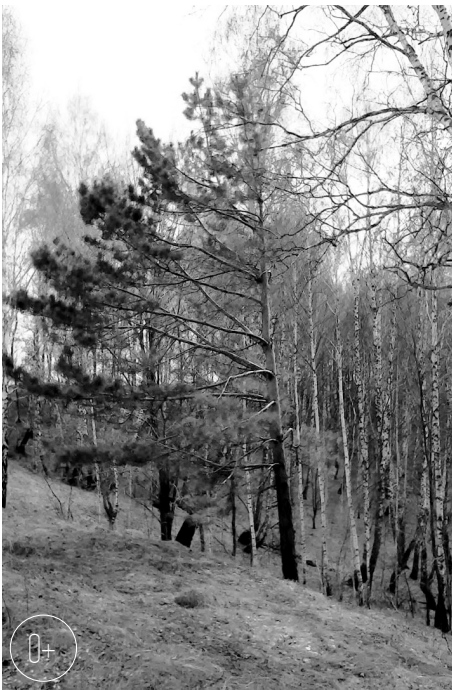
Зеленеет парус одинокий...

Орловцы могут рассказать об удивительных деревьях своей местности.