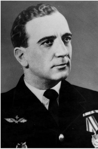
Пьер Пуйяд — командир авиаполка «Нормандия» после гибели Тюляна