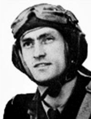
Нозль Кастелен, 16 июля