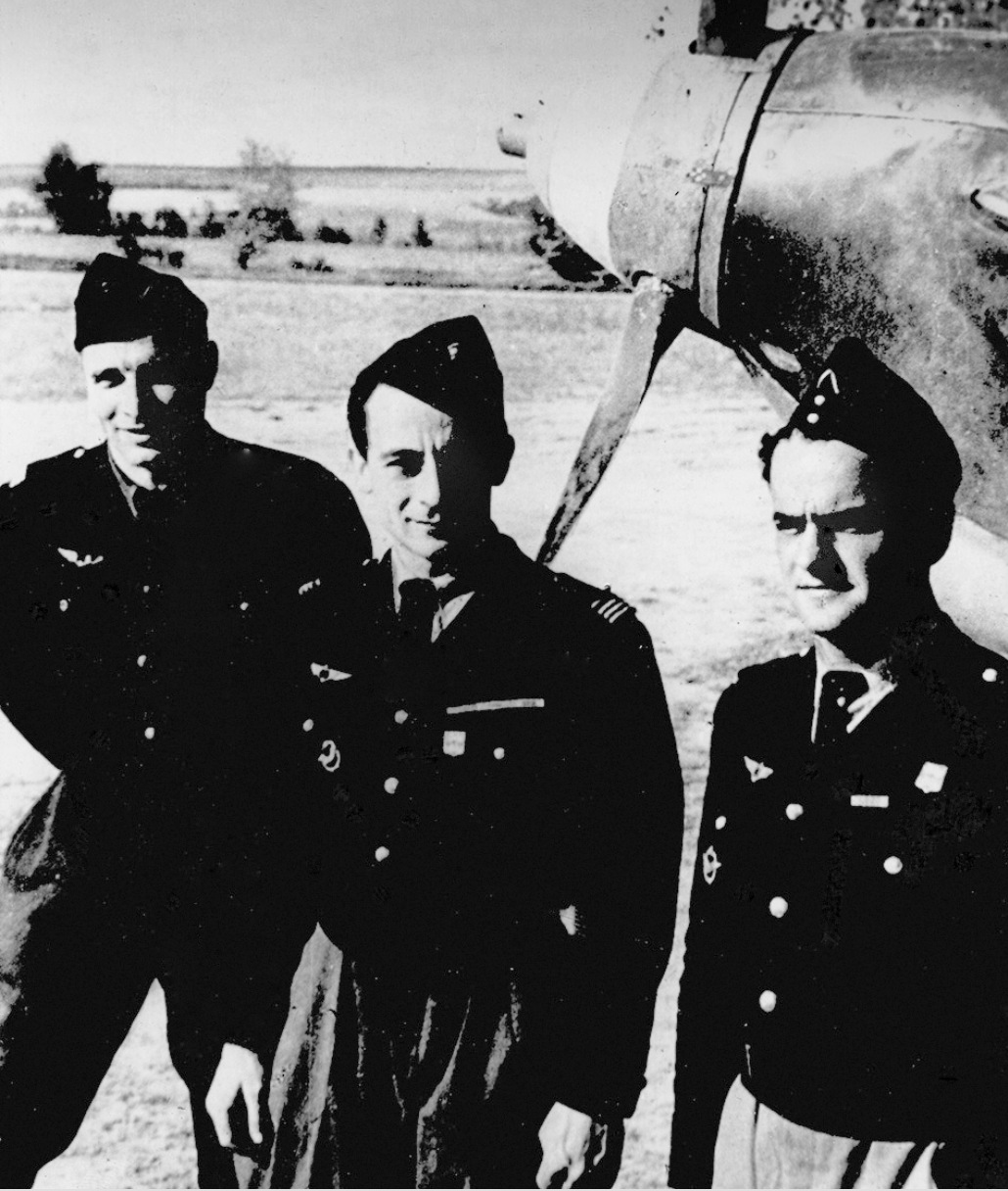
Жан Луи Тюлян и французские лётчики эскадрильи «Нормандия — Неман»

Юрки истребители Як-1 стрелой пронесли над ли-