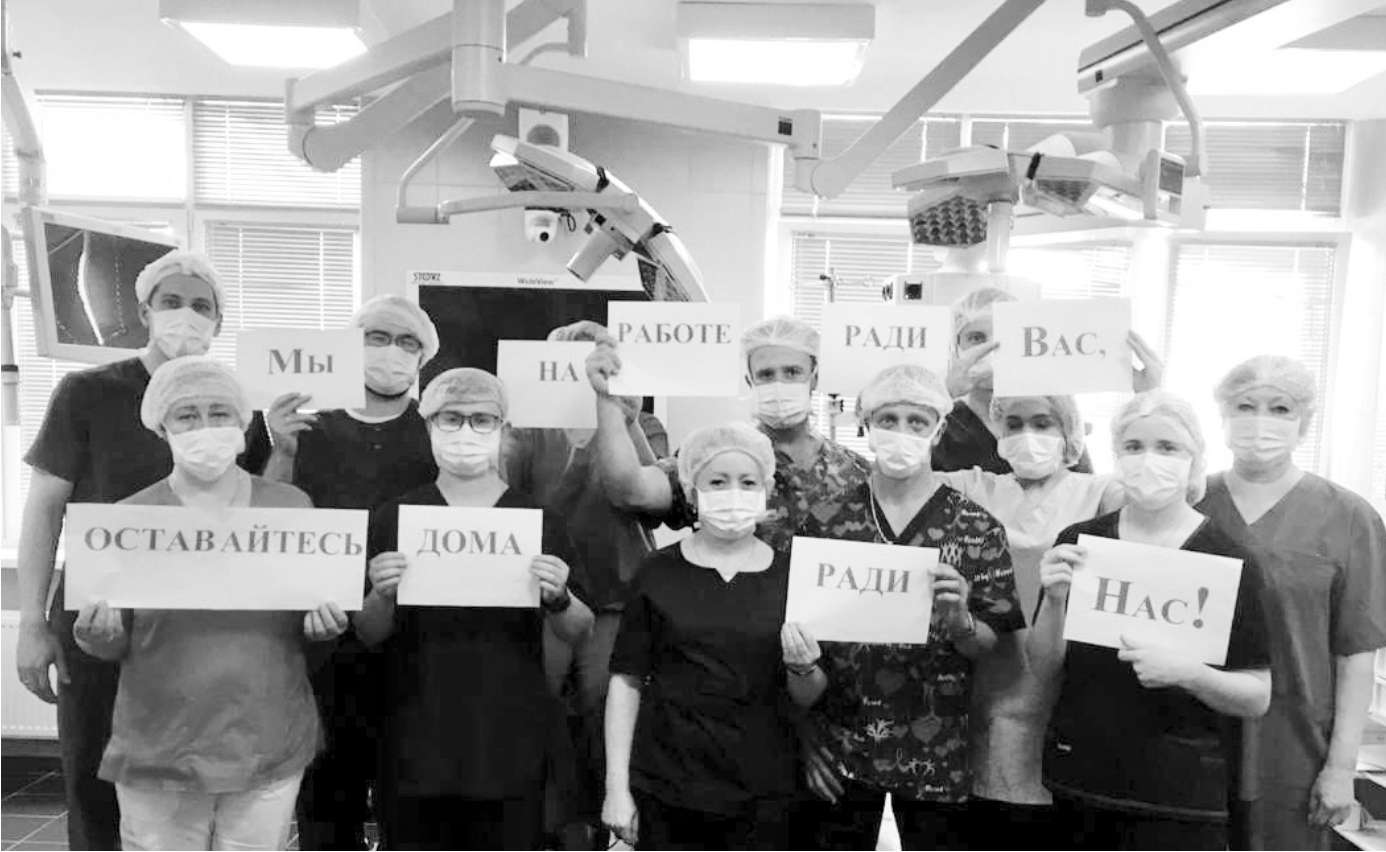
Медики городской больницы им. С. П. Боткина призывают орловцев оставаться дома