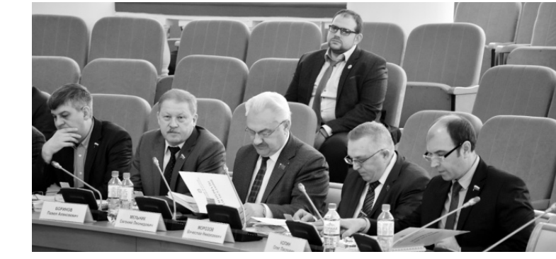
Депутаты облсовета обсудили итоги социально-экономического развития региона за минувший год.

27 марта народные избранники на 45-м заседании облсовета рассмотрели около 30 вопросов. Мартовская сессия облсовета проходила в ограниченном формате в связи с введёнными в регионе повышенными мерами безопасности из-за угрозы распространения коронавируса без участия представителей общественных организаций, почётных граждан Орла и области. На портале Орловской области в сети интернет велась прямая трансляция заседания регпарламента. В нём приняли участие депутаты облсовета, члены Совета Федерации ФС РФ Владимир Крутой и Василий Иконников, депутат Государственной думы ФС РФ Ольга Пилипенко, члены правительства области, представители областной прокуратуры, региональной КСП.