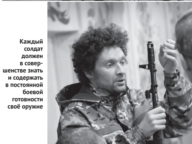
Каждый солдат должен в совершенстве знать и содержать в постоянной боевой готовности своё оружие

— Сегодня мы проводим в ПВР для кандидатов на подписание контракта на военную службу интерактивную выставку ору-