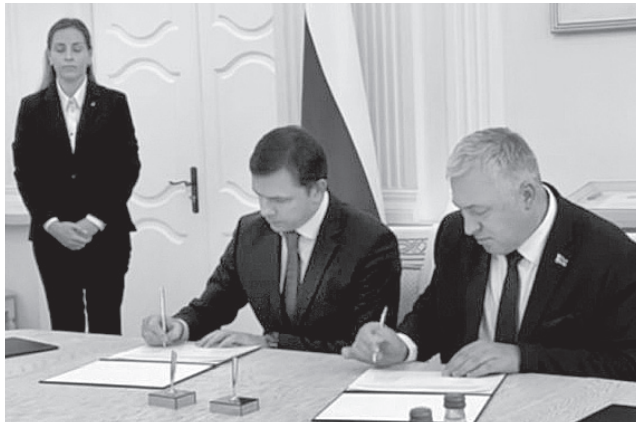
Подписанная дорожная карта укрепит сотрудничество в самых разных сферах

По словам главы региона, на новый виток развития выходят связи промышленных и сельскохозяйственных предприятий, строительного комплек-