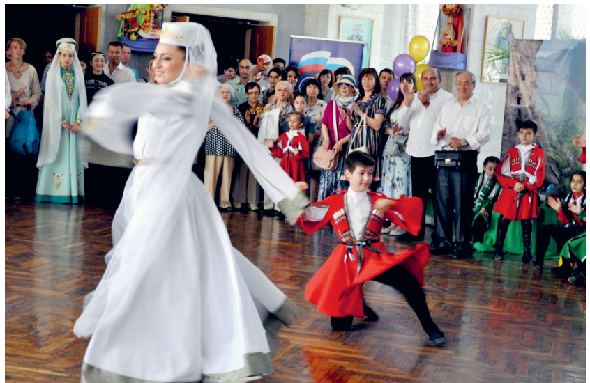
Орёл — территория дружбы