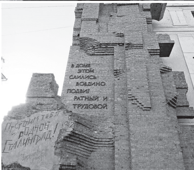
Стена-памятник на доме Павлова

В отдаленном от дорог старинном селе мемориальным воплощением любви к родной земле, беззаветной преданности земле отцов стоят памятник Глинкам, часовня на месте бывшего сельского храма, возрождённый колодец с чистой водой, реставрированный памятник погибшим воинам-освободителям села, валуны на месте домов жителей.