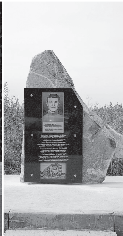
Памятный знак Илье Воронову в его родном селе Глинка

В отдаленном от дорог старинном селе мемориальным воплощением любви к родной земле, беззаветной преданности земле отцов стоят памятник Глинкам, часовня на месте бывшего сельского храма, возрождённый колодец с чистой водой, реставрированный памятник погибшим воинам-освободителям села, валуны на месте домов жителей.