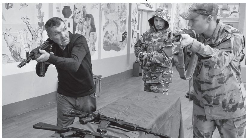
Занятия в ПВР проводят опытные инструкторы

Для будущих контрактников на базе ПВР организовано горячее питание. Инструкторы центра «Патриот-57» и «Бригады Катюкова» проводят с ними занятия по подготовке к боевым действиям.