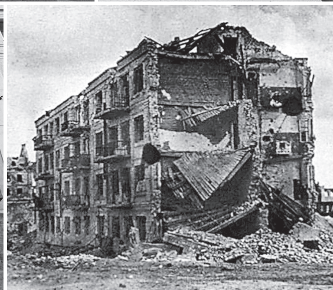
Дом Павлова — Сталинградская твердыня

Каждый из объектов установлен на средства выходцев из села. Они — потомки однодворцев, уехавших из родных мест, — остаются им верны, сохраняют свойственную предкам сплочённость, хозяйственную жилку, единодушие. И когда рождается идея очередного обустройства, помощники находятся быстро.