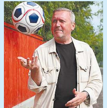
Александр РОГОЖКИН 3.10.1949

Он не только режиссер, но и историк-искусствовед. Наверное, поэтому после «Особенностей национальной охоты» была еще и «Кукушка».