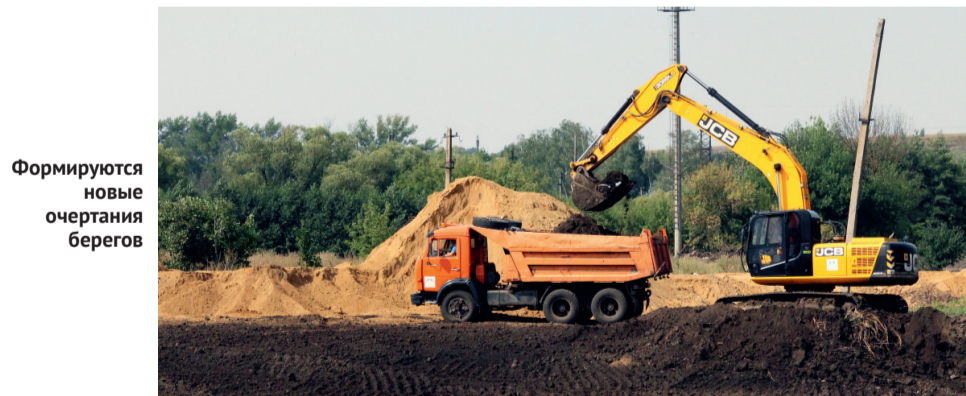
Формируются новые очертания берегов