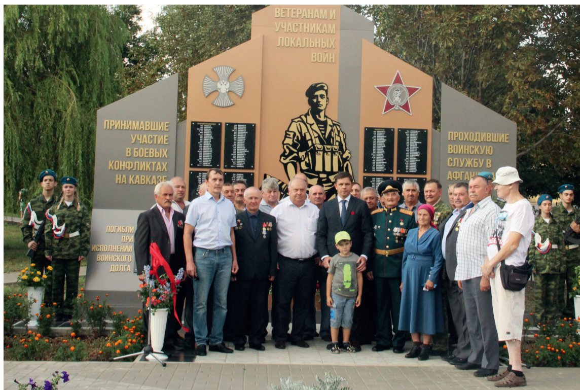
Мы нашей памятью сильны

Участники митинга минутой молчания почтили память погибших защитников Отечества и возло-