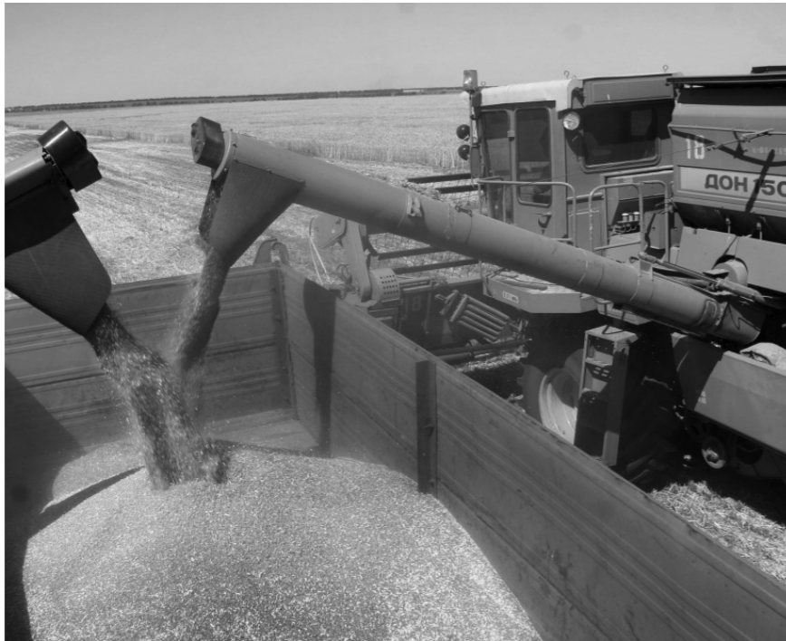
Зерно нового урожая

По информации руководителя регионального департамента сельского хозяйства Юрия Сидыганова, на утро 22 августа всего по области обмолочено 537 тыс. га зерновых культур — 63 % от плана. В том числе обмолочено 376 тыс. га озимых зерновых культур при средней урожай-