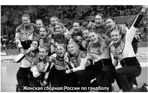
Женская сборная России по гандболу