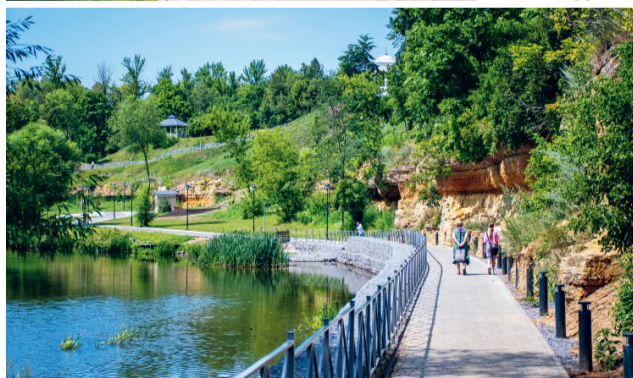
После реконструкции желающих прогуляться по Дворянке станет гораздо больше

дет применён способ полной переборки, так как часть конструкций находится в аварийном состоянии. Ввиду этого работы сейчас ведутся не с земли, а с высоты.