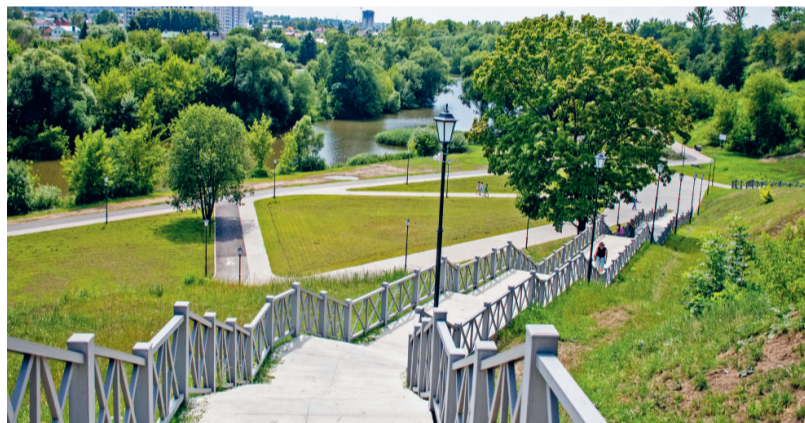
Дворянское гнездо гармонично влилось в общий ансамбль

— Это здорово, что появились такие объекты, где жители могут провести досуг, отдохнуть, где есть дорожки для велосипедистов, площадки для проведения массовых мероприятий. Дворянскому гнезду подарили вторую жизнь. Я удовлетворён состоянием лестничных маршей, скамеек, беседки. По этой территории,