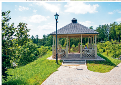
В резной деревянной беседке комфортно и в жару

По его словам, при реставрации дома Лизы Калитиной бу-