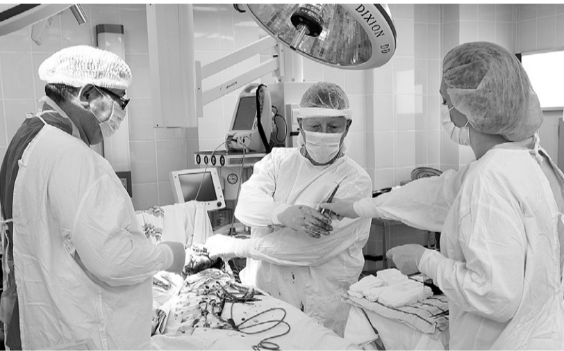
В операционной счёт идёт порой на секунды