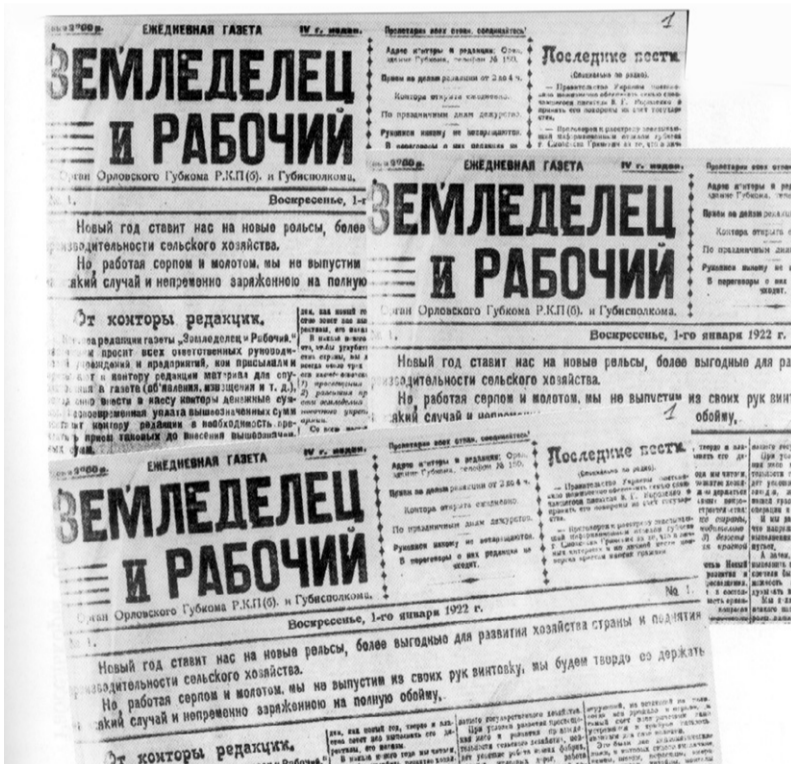
Агитационная роль прессы в 1920-е годы была огромной

«Даже беглый взгляд на литературу и журналистику тех лет оставляет неизгладимое впечатление от свежести и необычности языка.»