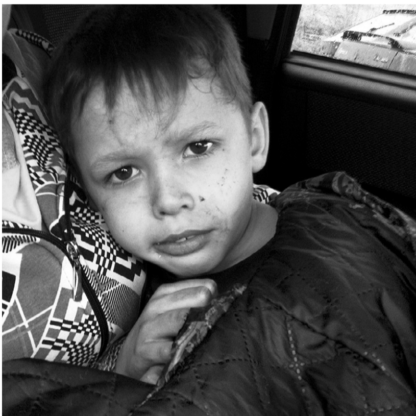
Пропавшие малыши до последнего надеются, что их найдут

После поступления заявки ребята связываются с родственниками, уточняют информацию, расклеивают ориентировки и начинают прочёсывать места, где теоретически может находиться пропавший человек.