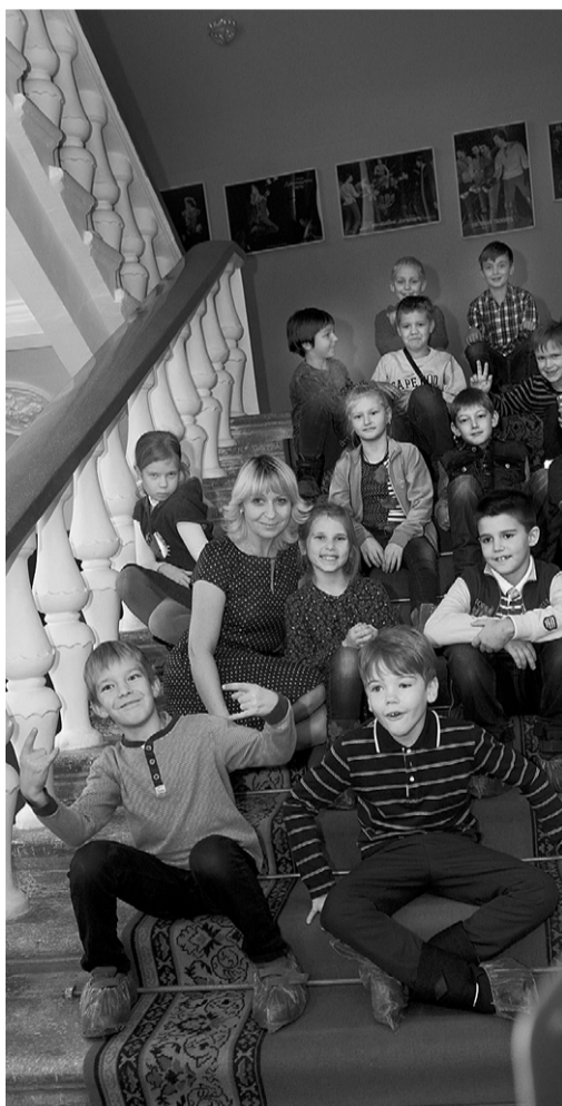
Школьники признались, что не ожидали увидеть столько интересного за кулисами