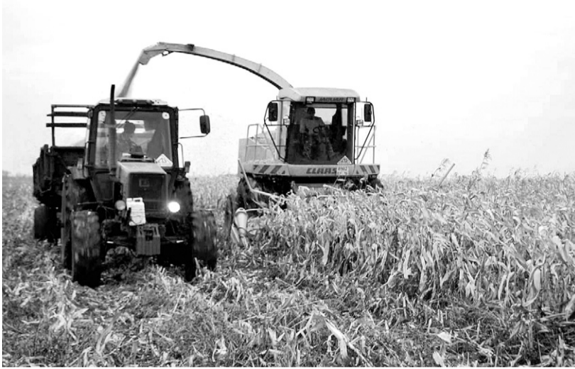
Урожайность кукурузы у свердловских аграриев — 78–100 ц/га

По прогнозам главного агронома отдела по управлению муниципальным имуществом и вопросам сельского хозяйства администрации Свердловского района Елены Ланиной, сбор зерновых в этом году составит 174,5 тыс. тонн при урожайности 33,1 ц/га. Таким образом, район побьёт свой прежний рекорд, установленный в 2008 году, — 171,2 тыс. тонн.