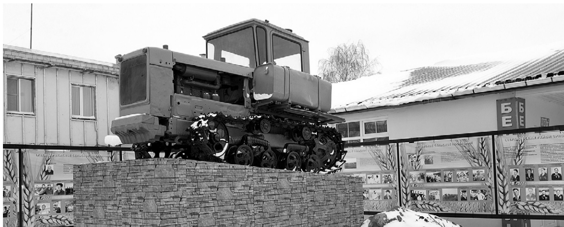
В Свердловском районе установили памятник заслуженным аграриям