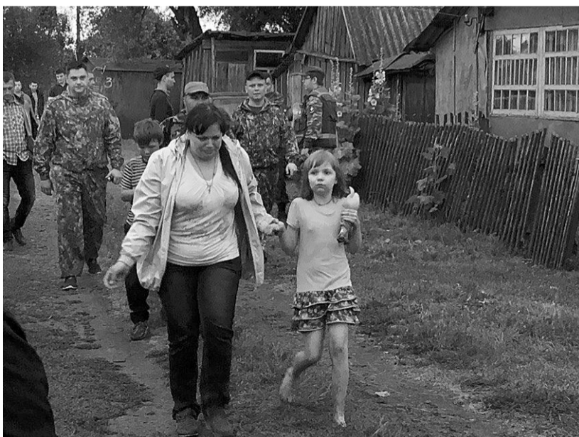
В поиске пропавших детей не должно быть равнодушных