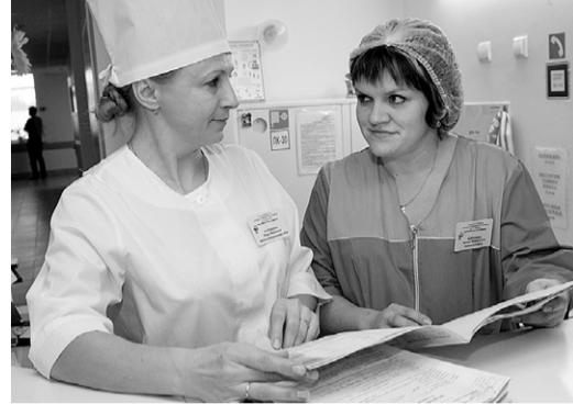
Медсестра — первый помощник врачу

Мы поддерживаем деловые связи с ведущими медицинскими вузами Москвы, Курским и Смоленским медицинскими университетами. Наши врачи участвуют в работе конференций, съездов, семинаров. Каждые пять лет медики проходят курсы повышения квалификации, поэтому у наших сотрудников достаточно высокий на-