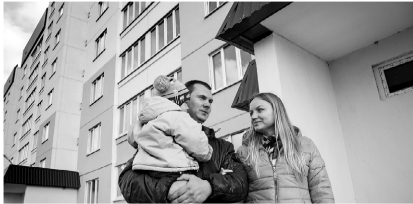
И будут крепнуть семьи

То есть темп реализации проекта сопоставим разве что с темпом, в котором играют российские футболисты. На 2017 год подпрограммой предусмотрено бюджетное финансирование в размере 49,5 млн. рублей. Скажем, область готова увеличить свой вклад в со-