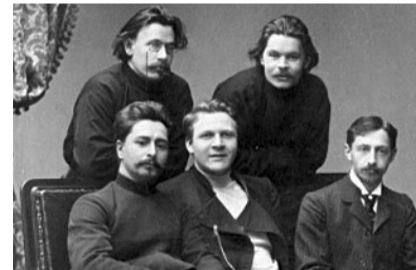
Леонид Андреев, Фёдор Шаляпин и Иван Бунин (в первом ряду)

Под таким названием в отделе краеведческих документов областной библиотеки им. И. А. Бунина открылась книжная выставка.