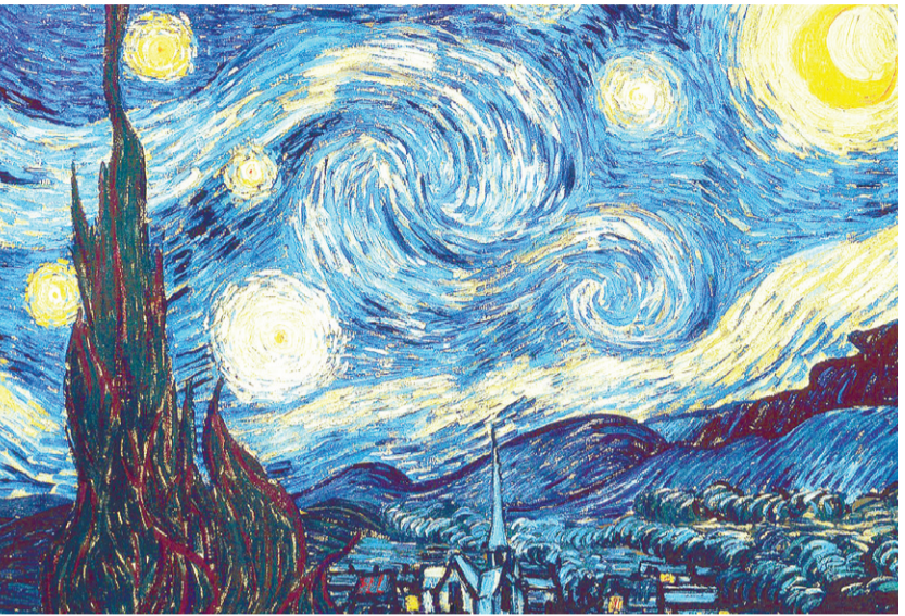
«Звёздное небо». 1889 г.

молодому поколению. Появилась возможность детально и подробно изучить наиболее известные произведения постимпрессионизма кисти Ван Гога, узнать историю жизни художника, а также поучаствовать в творческих мастер-классах «Рисуем карти-