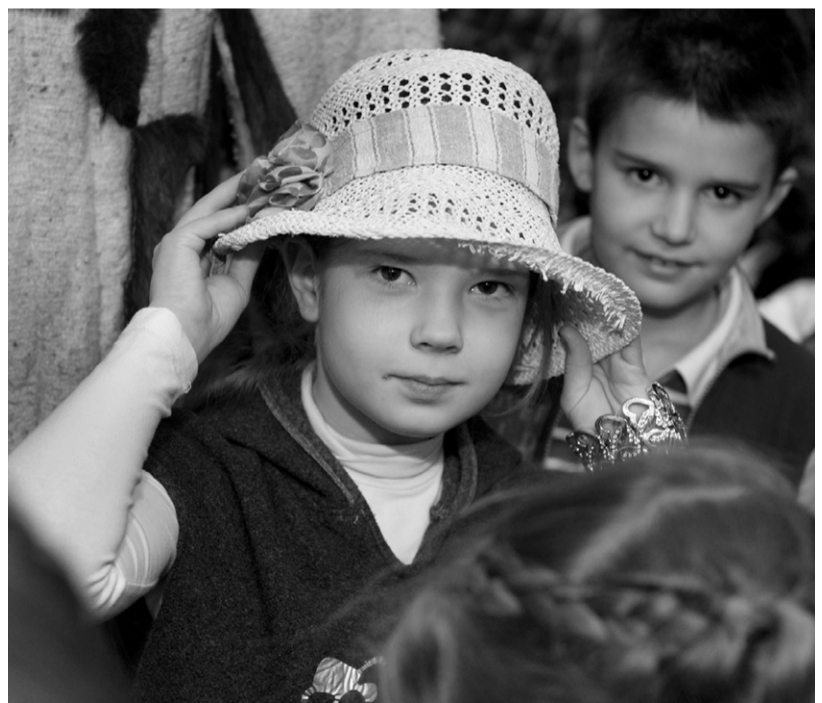
Девчонки примеряют театральные шляпки с благоговением

все драгоценности персонажей: картонные бриллианты, алмазные подвески и проч.