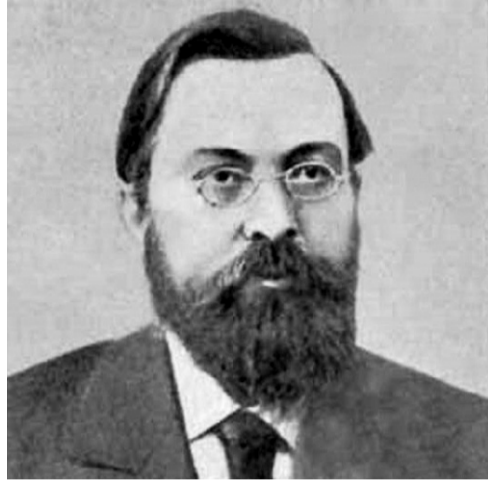
Николай Кутлер был кадетом, партию которых Пётр Столыпин называл «мозгом страны»

Будучи депутатом 2-й Государственной думы, которая проработала одну сессию (с 20 сентября по 2 июня 1907 г.), Кутлер возглавлял в ней финансовую, а затем и аграрную комиссии, выступал по аграрному вопросу, до-