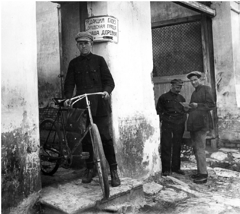
Журналисты были в самой гуще жизни