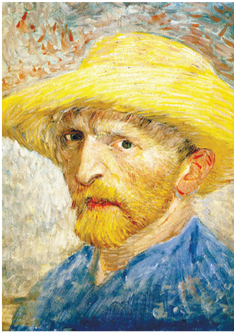
«Автопортрет». 1887 г.

«Удивительный мир Ван Гога, полный экспрессии, внутренней борьбы и фантастической красоты, не оставляет равнодушными даже далёких от искусства людей.»