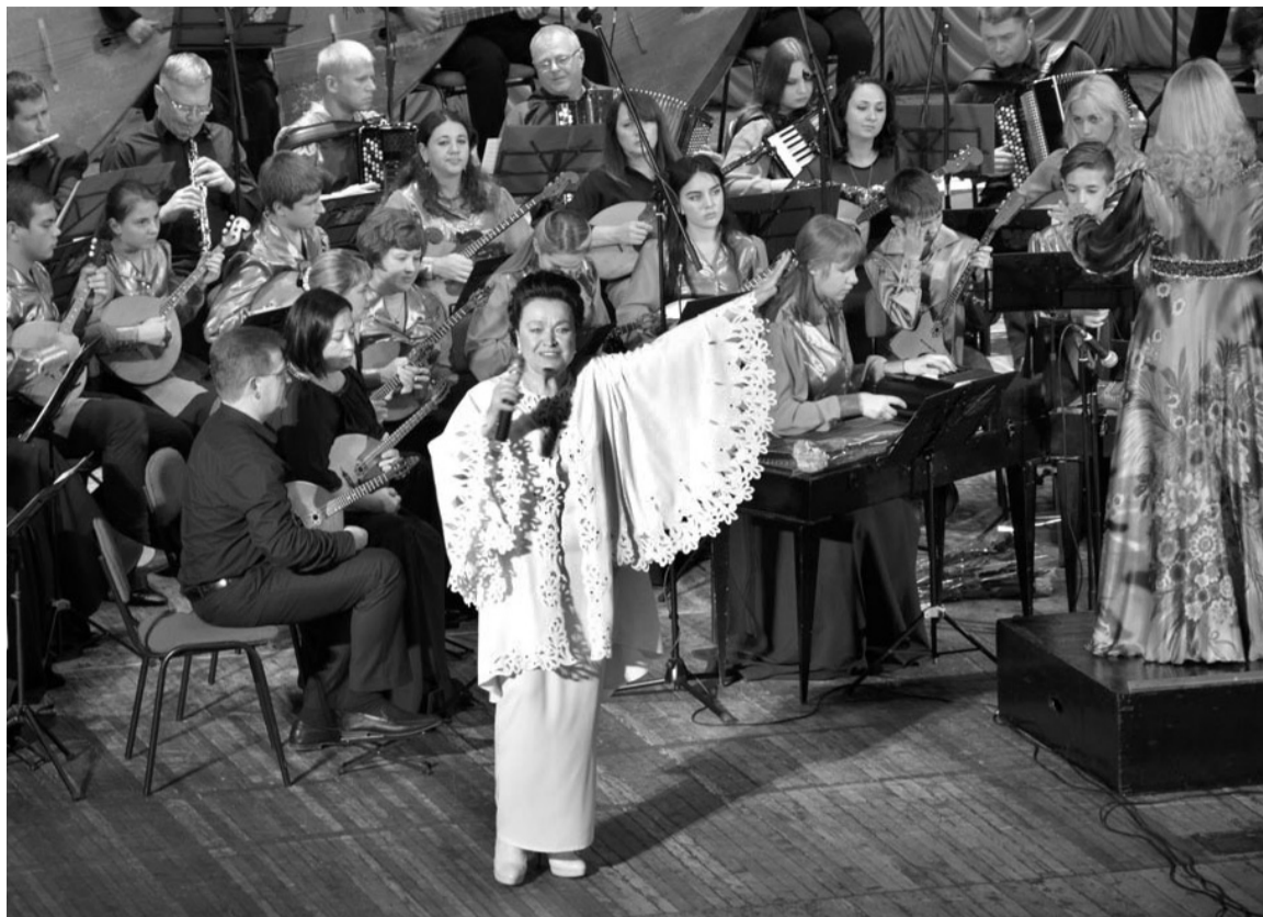
Песней лётся русская душа