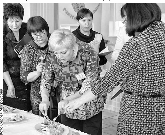
Жюри оценивает мастерство конкурсантов

Члены жюри, состоящего из опытных специалистов орловских ресторанов, столовых и кафе с удовольствием продегустировали конкурсные блюда, оценив их художественное оформление и вкусовые качества.