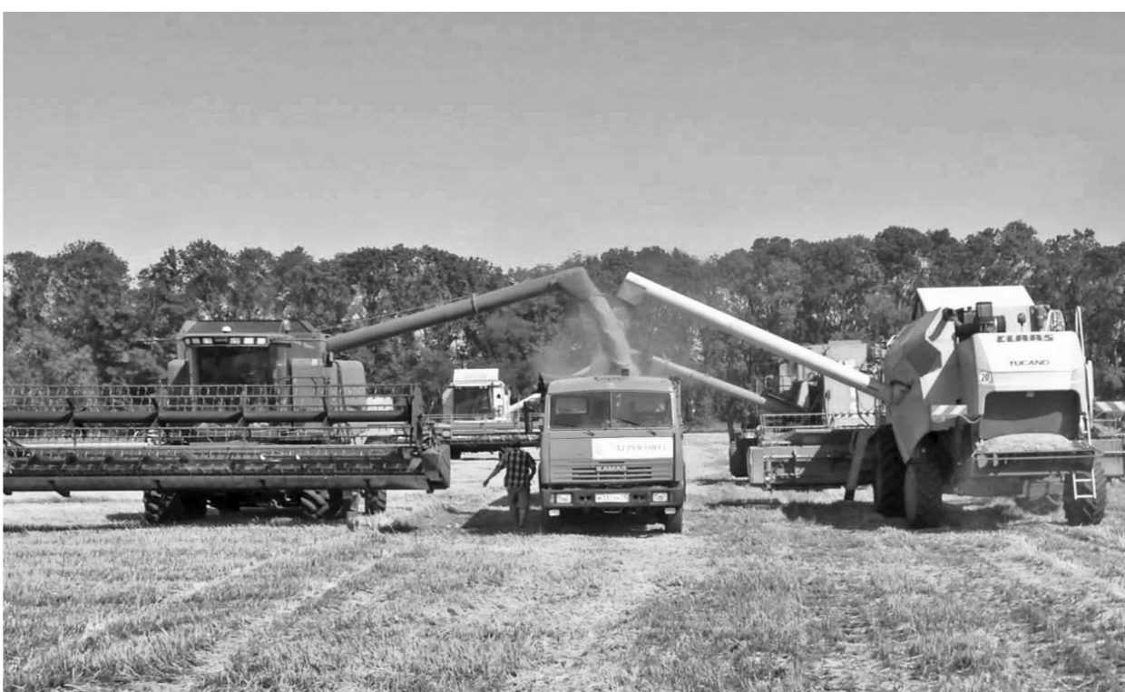
Каждый бункер зерна — в общую копилку

— Потенциально 2016 год мог стать для нашего района выдающимся. Намолочено свыше 200 тыс. тонн зерновых и зернобобовых культур, фактически столько же, сколько получили в памятном 2014-м. Тогда намолот составил 214 тыс. тонн. Если бы не дожди и связанные с этим немалые потери на хлебных полях, результат мог бы оказаться намного выше. Но, как говорится, что есть, то есть. Спасибо земле и людям, растившим хлеб, за этот щедрый каравай. В целом наш показатель оказался третьим в области после Ливенского и Покров-