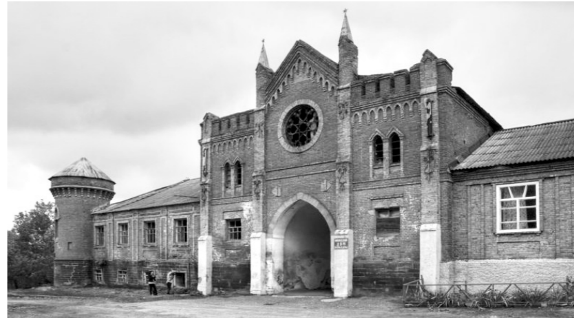
«Замок Охотникова» — жемчужина на туристической карте района