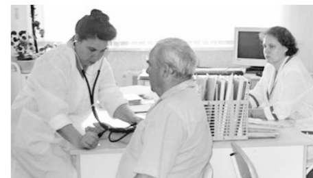
Врач — контролёр здоровья

В Орловской области наблюдается снижение уровня смертности.