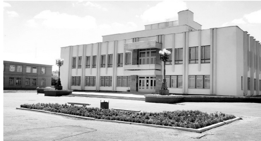
В районном Доме культуры разместились местный краеведческий музей