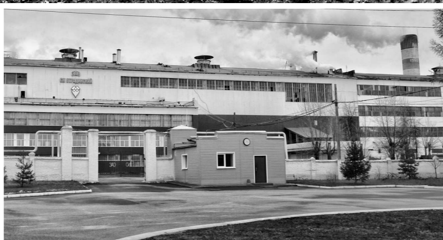
Отрадинские сахаровары диктуют свекловодам свою волю