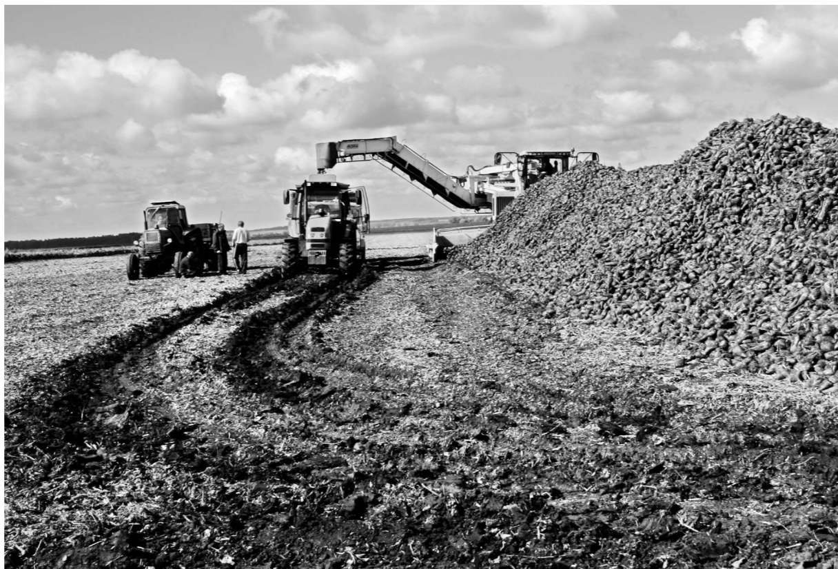
Из 15 сельхозпредприятий, которые сдавали свеклу на Отрадинский сахарозавод, только девять орловские

Аграрии пригрозили сахароварам разбирательством. Тогда свеклопереработчики в своей испытательной лаборатории