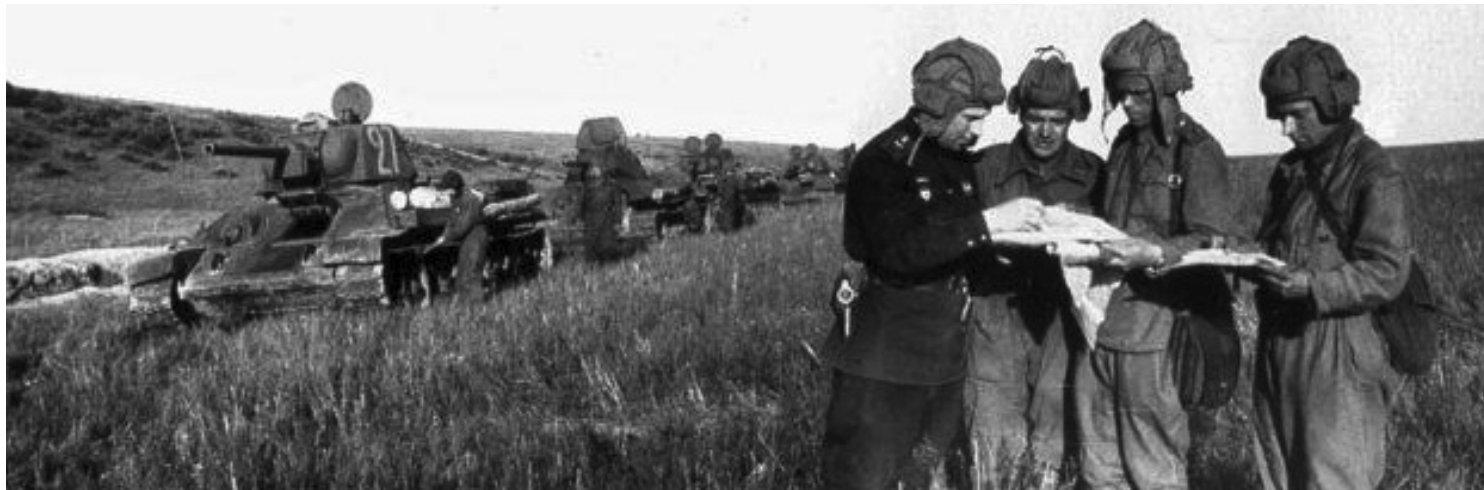
Танковый корпус в боях за Болхов