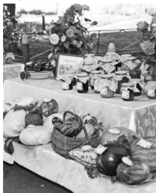
Дары осени с учебно-опытного участка Ярищенской школы

Посещение районов представителями власти — давно сложившаяся практика, и целью своей оно ставит скорее не контроль, а более детальное знакомство с общим положением дел в том или ином муниципальном образовании. Это позволяет нам на месте, общаясь с руководством