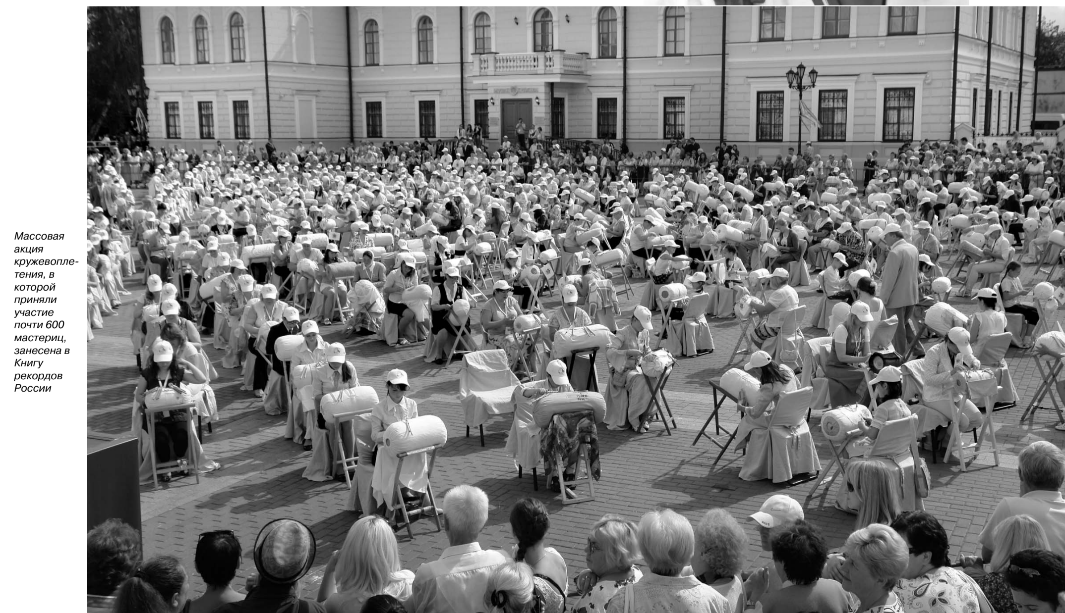
Массовая акция кружевоплетения, в которой приняли участие почти 600 мастериц, занесена в Книгу рекордов России