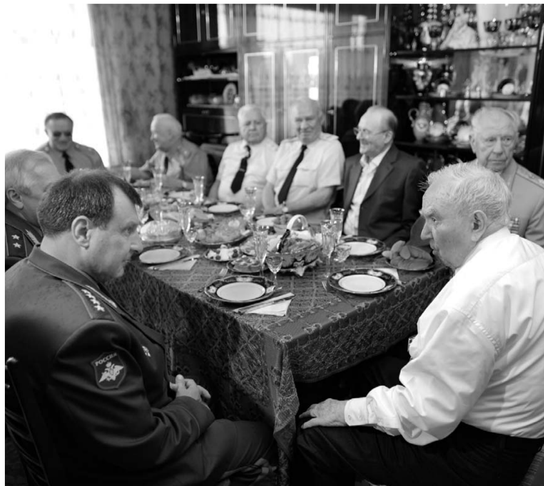
За праздничным столом маршал отказался от фронтовых «ста грамм»

Доброго Вам здоровья и бодрости духа! Региональный Координационный совет ОНФ