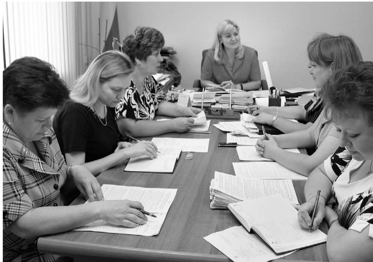
Иногда на заседаниях комиссии бывает горячо

работодателей области повысили зарплату сотрудникам после общения с налоговиками