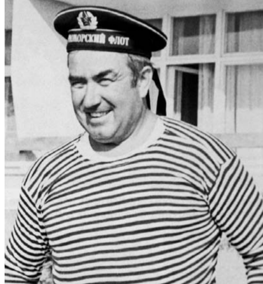
В санатории «Крым». 1968 год