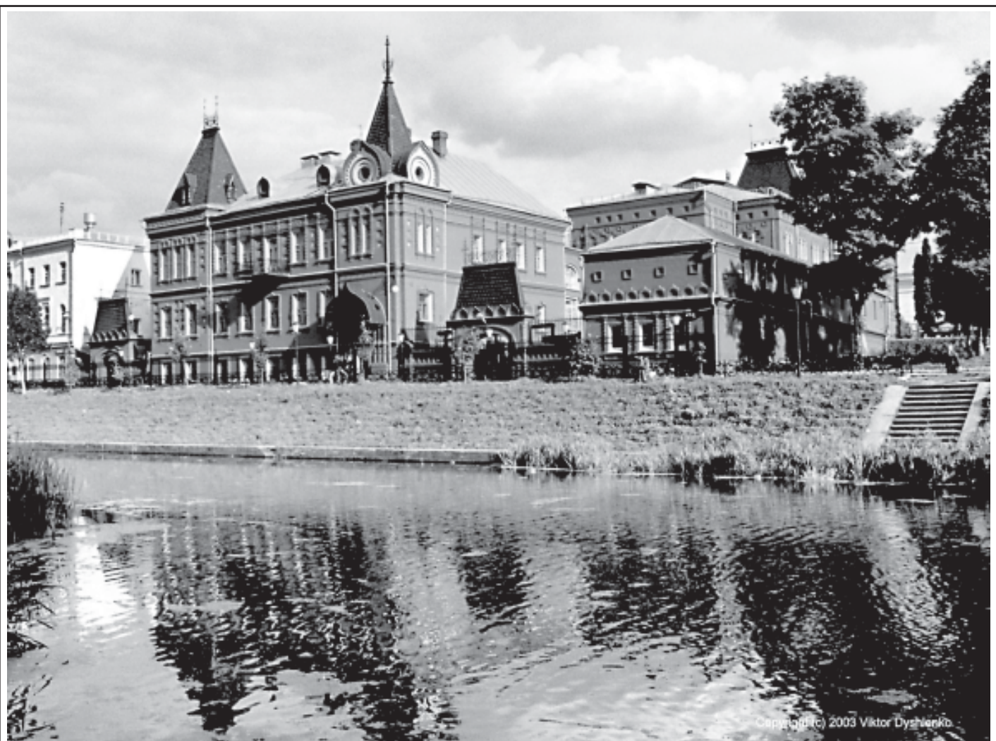
ДРЕВНИЙ И ВЕЧНО ЮНЫЙ ОРЕЛ.