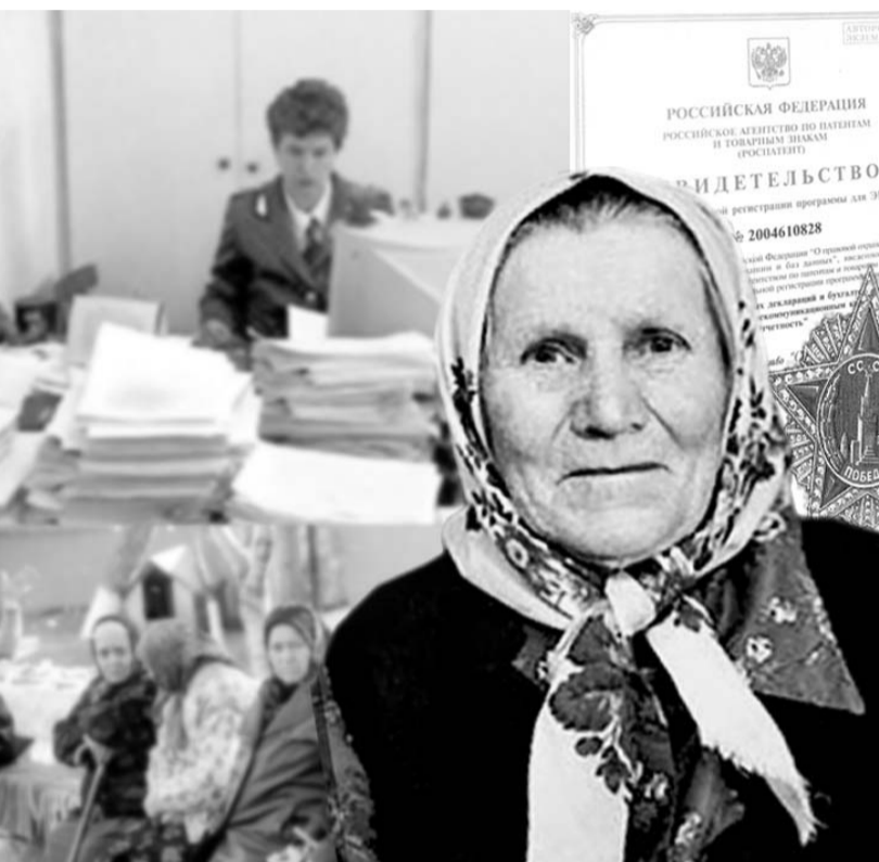
Коллаж Сергея МИРОНОВА.

Не правда ли, запутанная история? Когда со Дня Победы