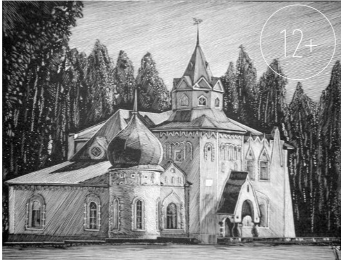
Дом Телегина после реставрации