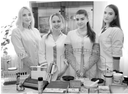
Команда молодых медиков