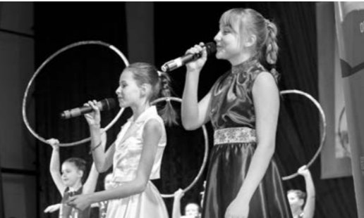
Праздничный концерт для участников и гостей чемпионата

колов, правительство региона стремится к тому, чтобы в Орловской области система среднего специального образования отвечала самым современным требованиям и