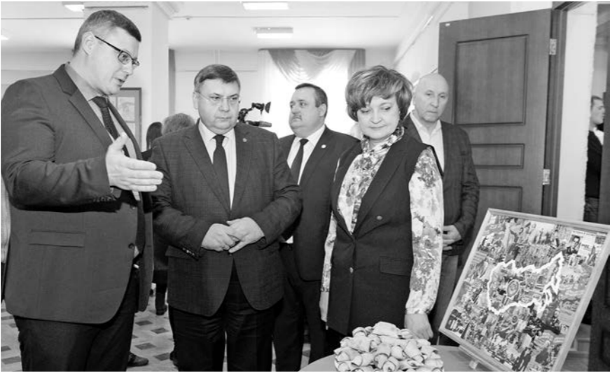
Почётные гости посетили выставку, организованную участниками чемпионата