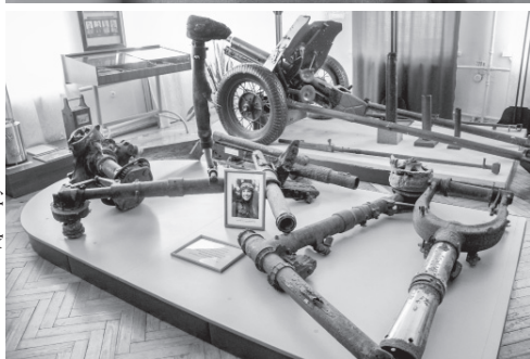
Детали самолёта Антонины Лебедевой в Болховском краеведческом музее