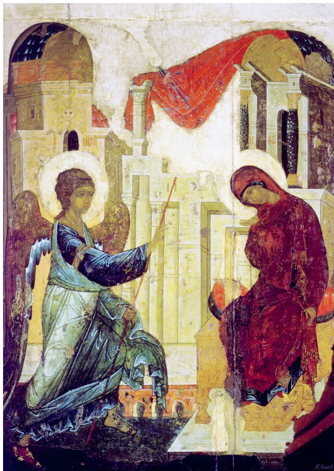
Андрей Рублёв. «Благовещение»