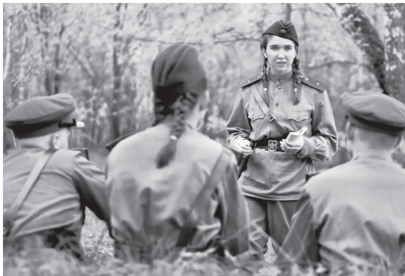
Кадр из документально-игрового фильма «Шлемофон с косичками»