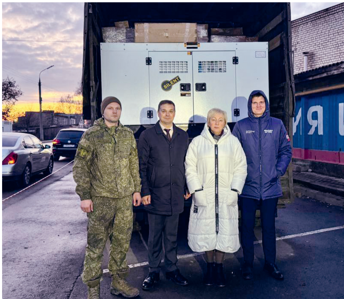
Гружённый ценным оборудованием КамАЗ готов к отправке в зону СВО