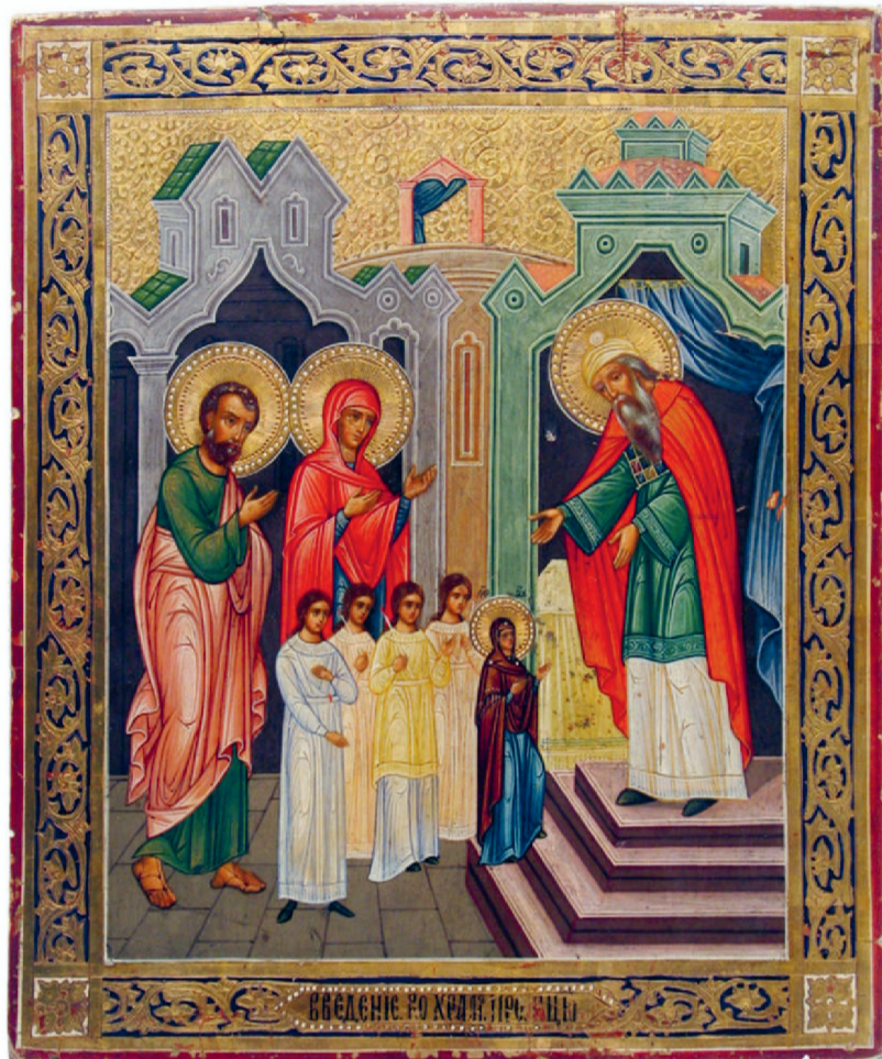
Икона «Введение во храм Пресвятой Богородицы»

Вспомним, что недавно в празднике Рождества Богородицы мы радовались тому, что началось исполнение чаяний ветхозаветных праведников и родилась Та, Которая должна была даровать Свою пречистую плоть грядущему в мир Сыну Божию. Со дня Своего рождения Она была избранницей Божией и с самого детства носила в Себе всю возможность человеческого спасения. Но о всём этом тогда ещё не было явлено миру. Только родители Богородицы — праведные Иоаким и Анна, для которых рождение Пресвятой Девы было связано с исполнением их сокровенных чаяний и горячих молитв, предчувствовали значение