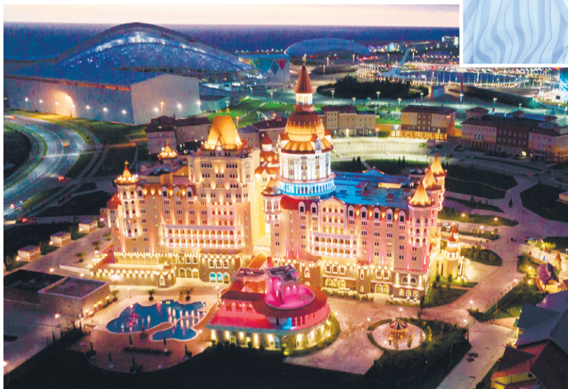
Гостиница «Богатырь» в Олимпийском городке

Гагарина, второго по значимости после энхаэловского Кубка Стенли, массовые лыжные катания на уникальной Красной Поляне, до которой знаменитым австрийским да швейцарским курортам, как до неба.