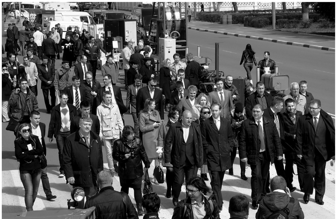
Глава Минпромторга Денис Мантуров по достоинству оценил промышленный потенциал Орловщины

— Конечно, мы не стоим в стороне, ищем возможность помочь «Дормашу». Что планируем сделать? Во-первых, хотим приобрести некоторое количество грейдеров этого предприятия, чтобы вырубенных средств хватило на выпла-